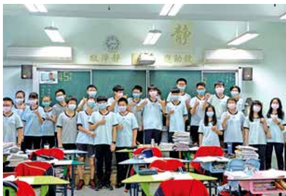
感謝學校安裝冷氣，讓長時間待在校的課後照顧班，更有精神地延續學習。

夠、線路老舊有無必要重整等，希望藉由電力系統之改善與評估，為裝設冷氣做好準備，使孩子免於酷暑下揮汗上課，讓每所學校皆能在優質的環境下努力辦學，提昇南投競爭力，培育出下一代優秀學子。