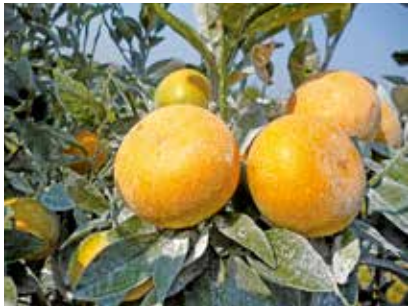
社區內種植的茂谷柑