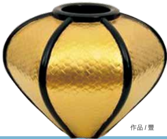
作品 / 豐

因為學習領域廣，充實了黃麗淑日後創作與教學的深度與廣度；她的作品媒材非常多樣，結合木、竹、藤、石、金屬等技藝，對周遭環境觀察入微，從生活文化的體驗出發尋找創作題材，深具藝術家觀察敏銳的天性。令人感佩的是，黃麗淑的創作雖然是從傳統工藝出發，但是卻能持續不斷創新，賦予作品高度的現代感。