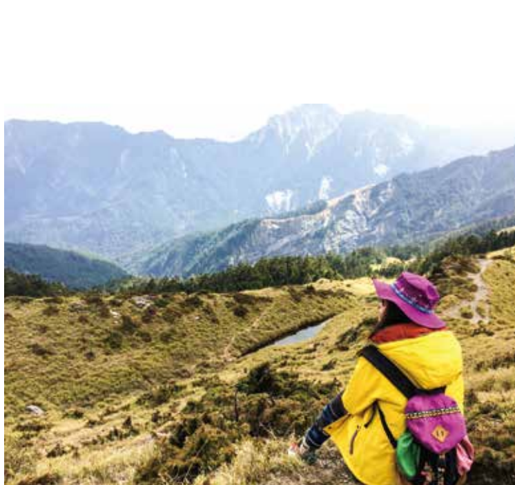
走在石門山步道的秀麗山景

石門山位於南投縣仁愛鄉合歡山旅遊線上，從埔里走台 14 線往花蓮方向走，經霧社後轉台 14 甲線經清境、翠峰、昆陽、松雪樓，繼續往前約 400 公尺就可到達石門山登山口。石門山海拔高度 3,237 公尺，雖列為百岳之一，卻十分平易近人，為山勢坡度平緩的高山步道。步道全線長度僅約 750 公尺，路線大致與公路平行，沿線並鋪設棧道與石階，從登山口出發不到 30 分鐘就可以到達山頂，一般老人與小孩也都能順利走完。