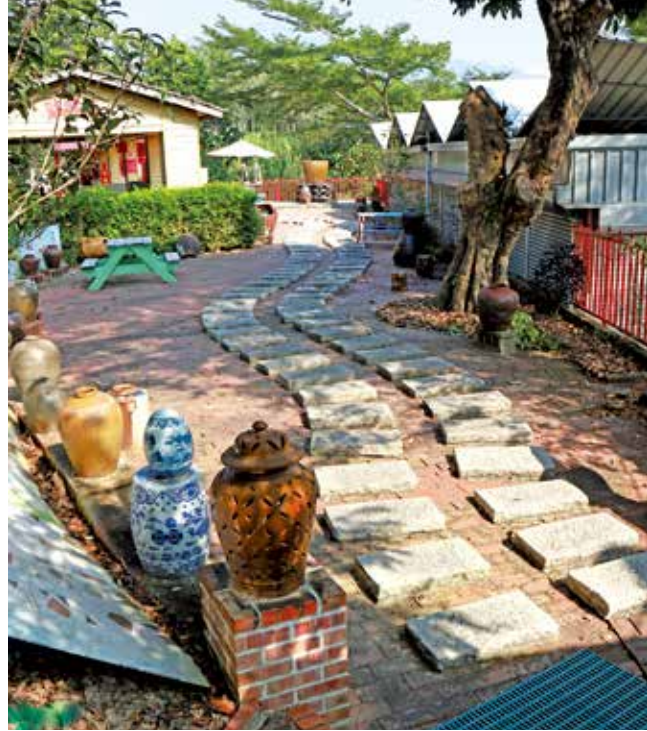
用各式陶罐裝飾的步道