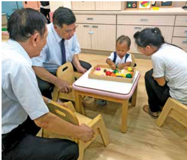
副縣長與幼兒一同玩樂。