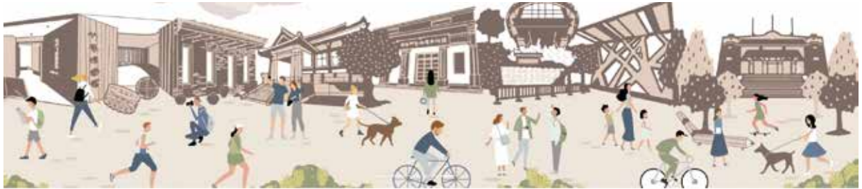
109 年南投縣博物館與地方文化館參與館舍

今年逢閏，中秋剛過，早晚也才開始有一點涼意，正是出門走走的好時機。疫情稍加趨緩，卻又面臨冬天另一波新冠病毒可能再起之勢，於是沒辦法出國旅遊的民眾，開始思考如何規劃不同以往的國民旅遊。這時，南投絕對是首選之一。不過也因為南投縣有太多知名的觀光景點，國人從小到大，從畢業旅行到家庭旅遊，幾乎都來過南投。想要安排一個吸引人的、有別過去的深度之旅，好像已經變成一種挑戰。