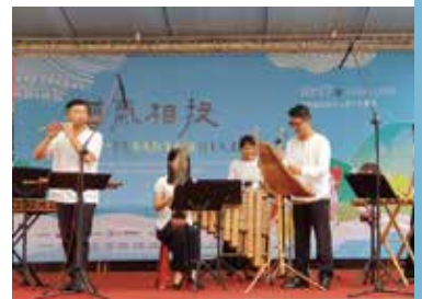
台灣竹樂團為成果匯演熱鬧揭開序幕