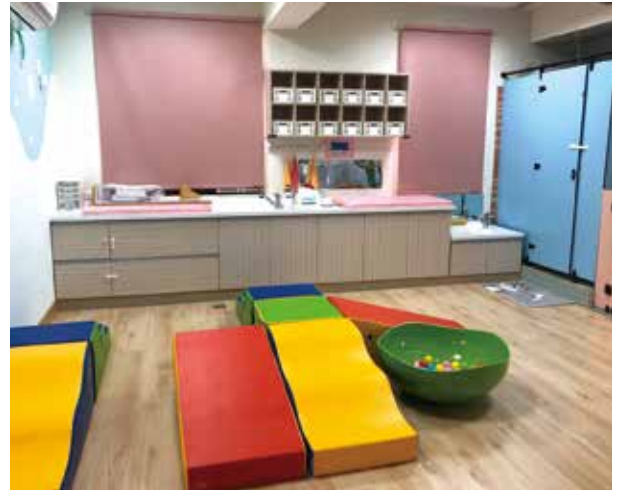
8個月至2歲遊戲區、護理台、尿布台