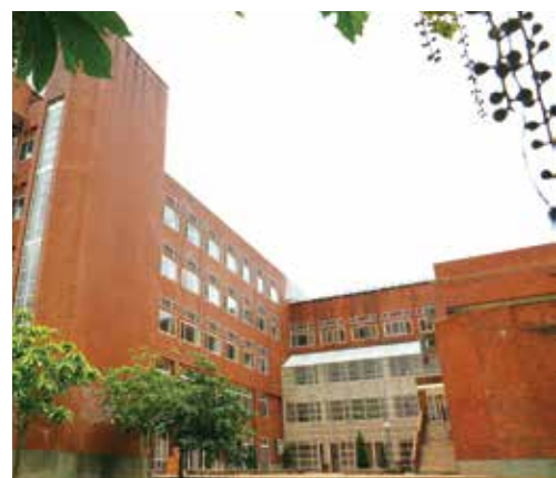
暨南大學釋出校舍屋頂辦理設置太陽能光電板

南投縣在林明溱縣長帶領下，積極推動落實節能減碳、開發永續能源等相關政策，自 108 年度起全力向經濟部能源局爭取補助辦理「綠能屋頂全民參與推動計畫」。