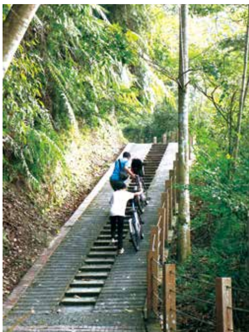
最後的好漢坡只能下車牽行而上

繼續往前騎乘，左手邊是湛藍清澈湖面，右手邊綠色楊柳斜倚路旁，伴隨輕風拂面令人心曠神怡。到達一處路線轉折處還有一個寬闊的平台，這裡是拍照打卡的熱門地點，許多遊客都會在此自拍或與家人合影留念。繼續進入林間路線，約 100 公尺之後來到一處協度很大的陡坡，看起來只能下車牽行通過，迎面走來的遊客告知這樣的斜坡會接續好幾段，於是便只好折返，結束本次的單車踏訪。