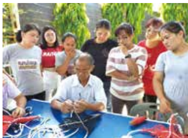
久美國小布農 davaz 背袋編織培育種子教師及教案製作工作坊

歡迎有意願參與推動南投縣藝文教育扎根計畫的藝文團體及單位聯繫本案計畫聯絡人：南投縣政府文化局藝術科 049-2231191 分機 510 李小姐、分機 514 胡小姐