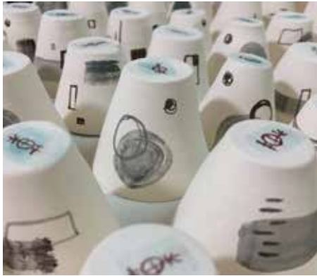
在陶器上的繪圖，多了年輕女孩的現代化筆觸。