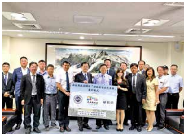
南投縣政府見證暨南國際大學與新明能源有限公司綠能屋頂全民參與計畫簽約儀式合影

國立暨南國際大學榮獲「UI GreenMetric World University Rankings 2019」評比為世界排名