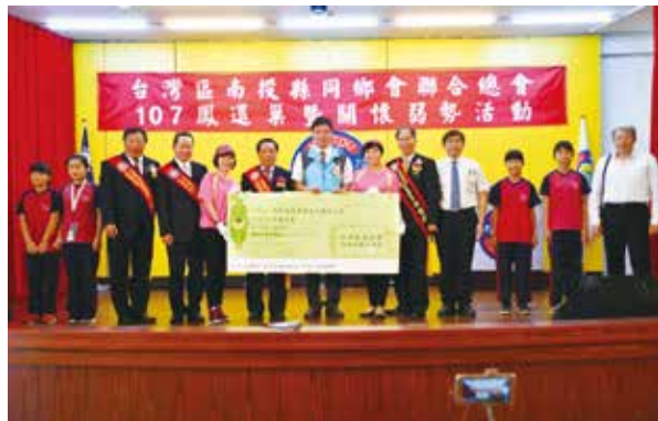
107 年鳳還巢活動 - 捐贈埔里鎮太平國小助學急難金