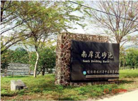
社區附近的賞遊景點