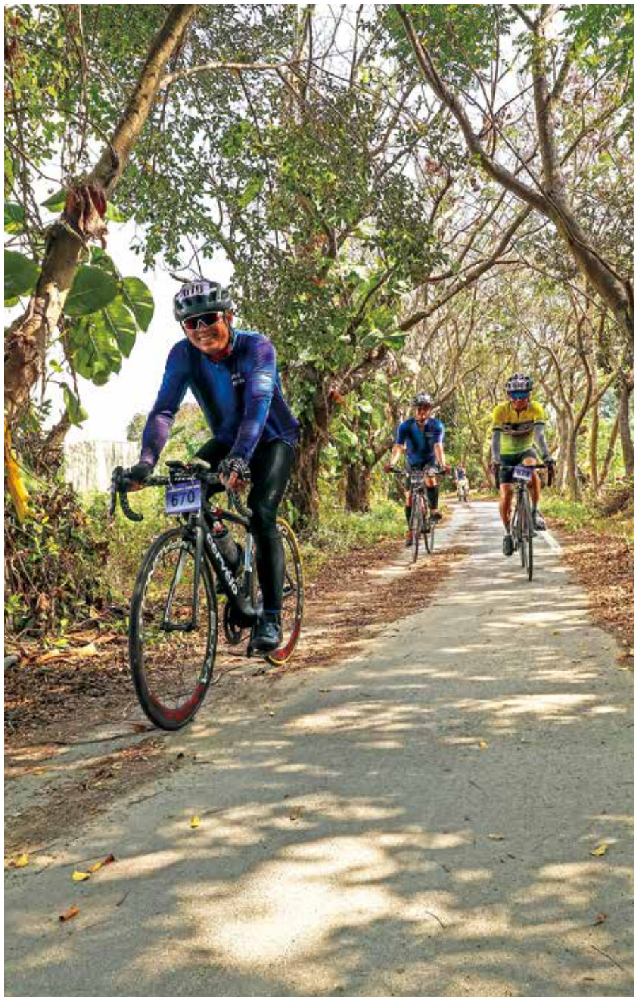
穿越台灣欒樹的迷人光影

清代地方仕紳於濁水溪設置免費渡船，嘉惠兩岸百姓往來，名間鄉與對岸的竹山鎮都曾豎立一座「永濟義渡碑」，後來分別收藏於名間福興宮、竹山紫南宮，為深具意義的重要文化資產。