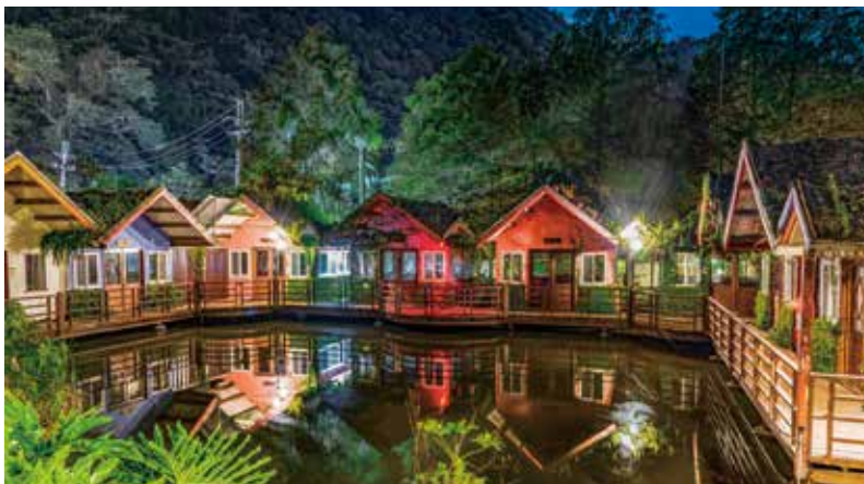
池畔餐廳區的炫麗夜色