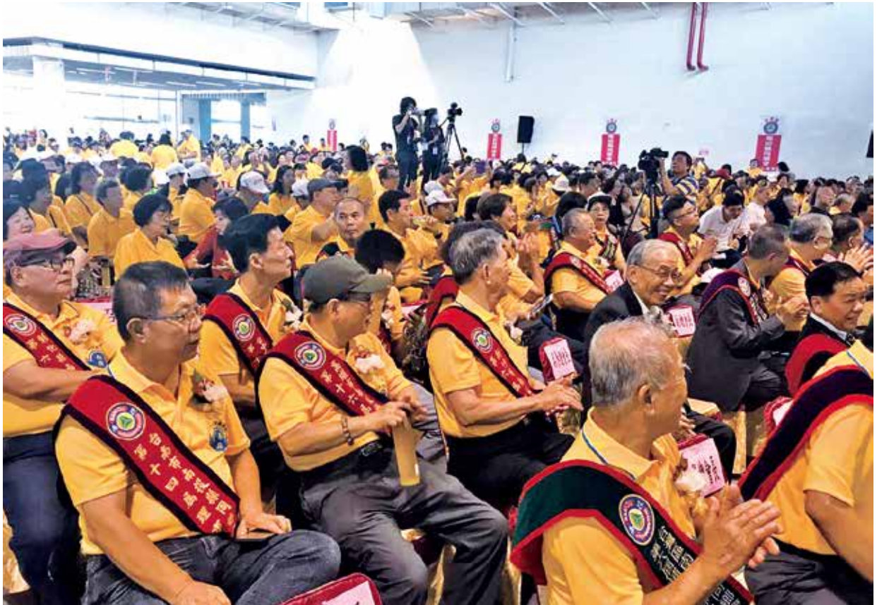
108 年鳳還巢活動現場