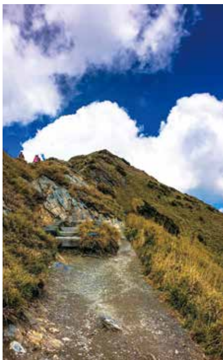
超過 3 千公尺的藍天白雲甚是迷人