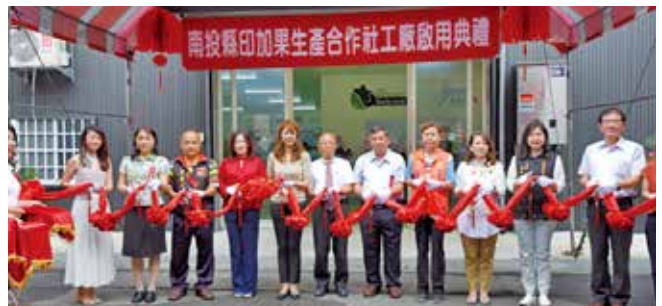
南投縣印加果生產合作社在南投市設立工廠，積極開拓市場。

正因為種植印加果有諸多優點，就這樣在南投農村刮起種植旋風。目前南投縣種植面積已經超過一百公頃，13 鄉鎮都有農民投入這項產業。