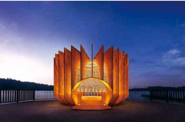
目前正在日月潭伊達邵碼頭展出的作品，在白天與夜晚、站在裡頭跟外部，都有不同的光影視覺效果。（展期至 2021 年 11 月）

找到還有誰會做這些用品，然後去拜訪這些老師傅跟他們學習。在參與學習的過程中，他不僅產生更高的興趣，更思考著如何將這些技術用得更精彩、創造更多可能性。一開始就先試著用來做一些小物件，後來接到一些客戶委託規劃創作大型的戶外裝置藝術，所以就將這些小物件的技術延伸出來去，放大尺碼，創造人可以走進去的空間裝置藝術。