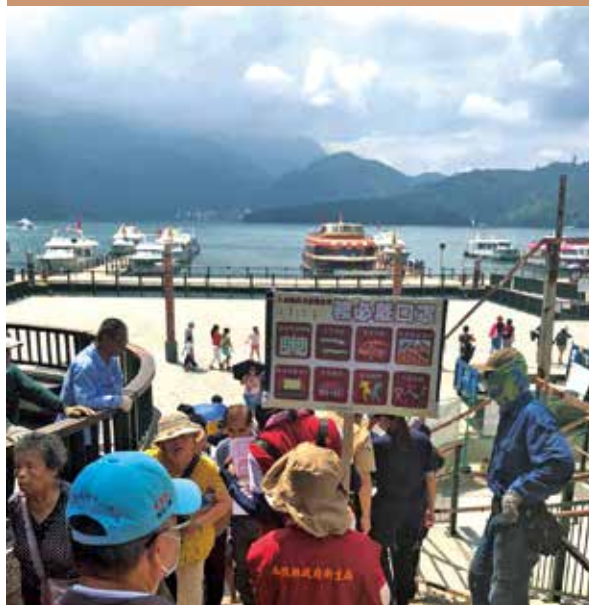
防疫宣導不中斷 - 風景區宣導

本縣觀光景點多，疫情期間民眾安心旅遊為本縣防疫重點推動工作，本縣由相關局處組成防疫宣導團隊在縣內風景區、夜市、黃昏市場、傳統市場