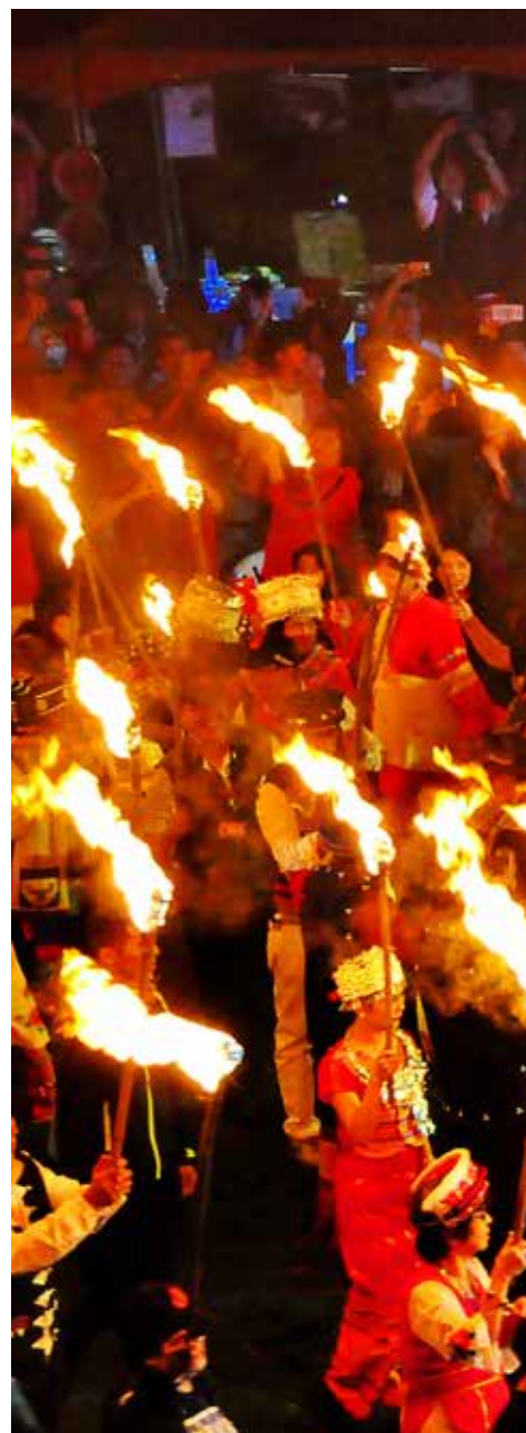
清境社區居民高舉火把，環繞篝火。

清境農場位於仁愛鄉台 14 線上，除了清境的青山草原、特色民宿、牧場風光之外，沿線還有包括霧社合歡山、奧萬大、武嶺等知名風景區；春