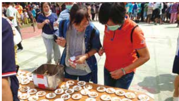
烤豬王大賽活動民眾試吃

關與評分，最後經現場民眾盲測評選，本次大賽排名為：特等獎：「海陸烤豬大隊」、頭等獎：「伍隻小豬」、金獎：「松式烤全豬」與「虹谷熊來夯」；其餘並列優等獎。