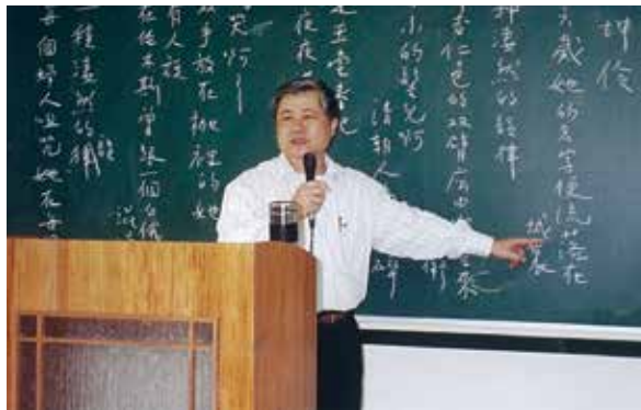
1998 年擔任南投縣文藝創作班講師