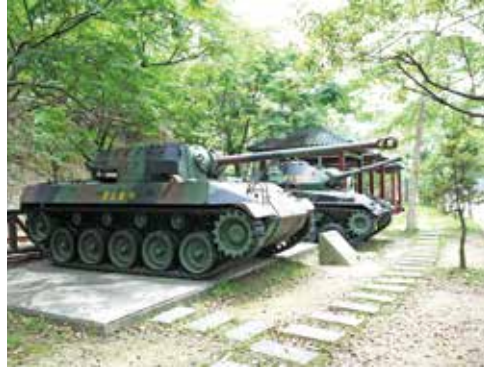
綠色隧道旁的戰車公園陳列著退役的戰車