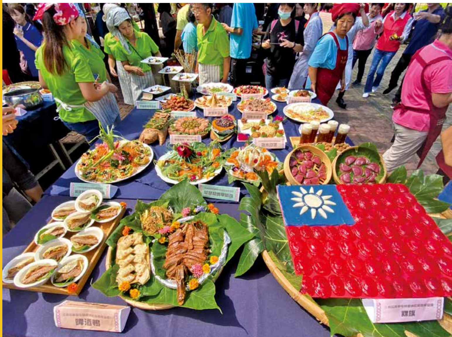
滿桌的社區手路菜創作成果，令人垂涎三尺