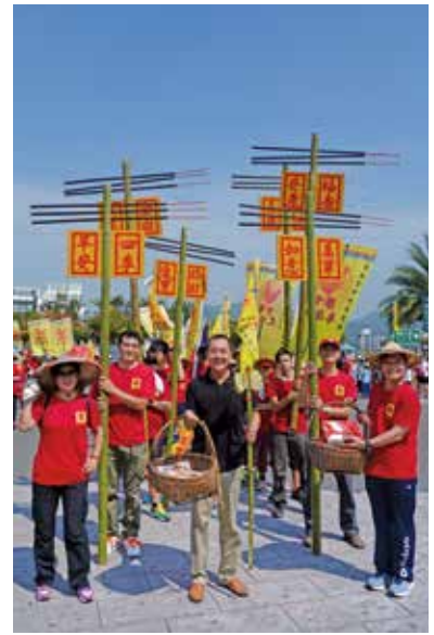
民俗活動居民同樂