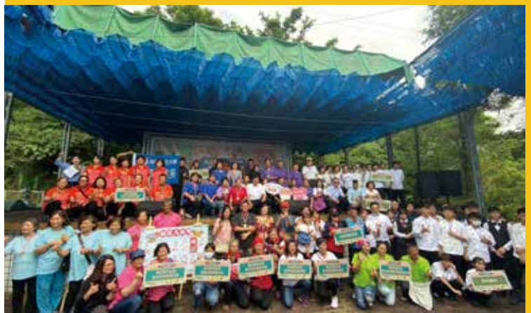
各路總鋪師齊聚一堂

本次競賽特別於虎山藝術館前舉辦，活動當日由草屯新厝社區長青表演團體帶來熱鬧擊鼓及舞蹈表演開場，搭配現場參賽隊伍的菜香味，現場活力四射。縣府秘書長洪瑞智由文化局長林榮森陪同蒞