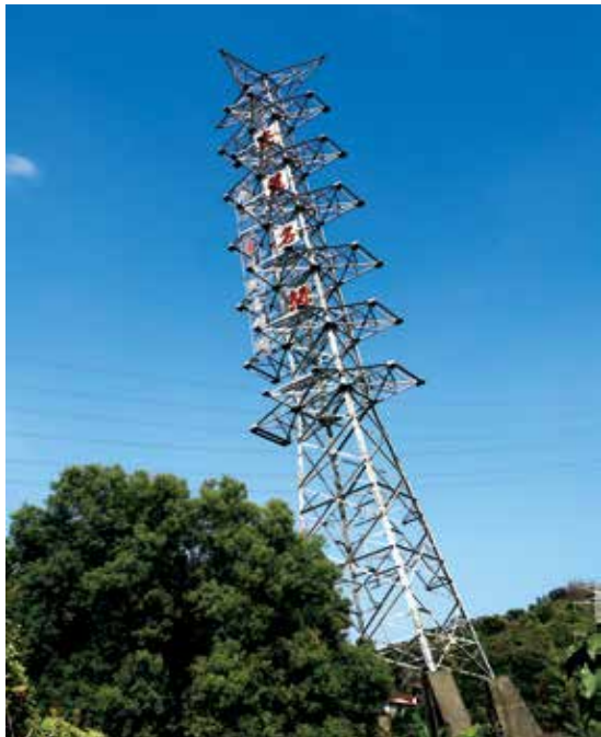
921 地震後保留至今的傾斜電塔