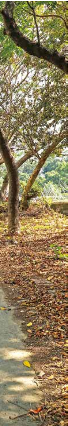
幽靜的鄉間小徑車道