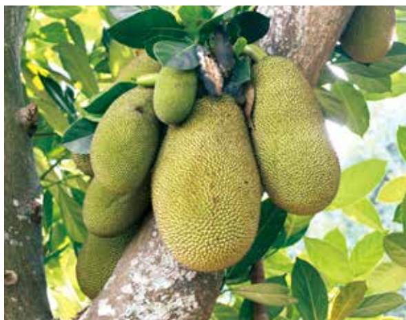
一開始車道路旁種了整排的波羅蜜樹