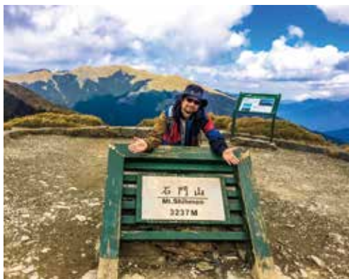
石門山頂標高 3237 公尺