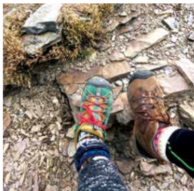
踏上台灣的屋脊感覺很奇妙

交通部觀光局將 2020 年訂立為「脊梁山脈旅遊年」，加上因疫情爆發無法出國旅遊，於是許多人選擇登高山、走入山林。「百岳」是眾多登山愛好者喜歡挑戰的目標，在南投、花蓮交界處的「石門山步道」就是百岳登山步道之一。