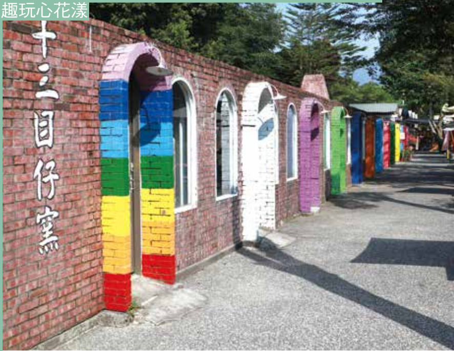
成排的七彩拱門就是最佳拍照背景