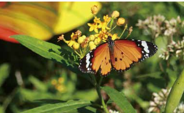
蝴蝶迷宮內到處可見彩蝶飛舞