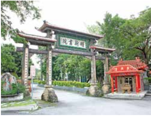
南投四大書院之一的明新書院