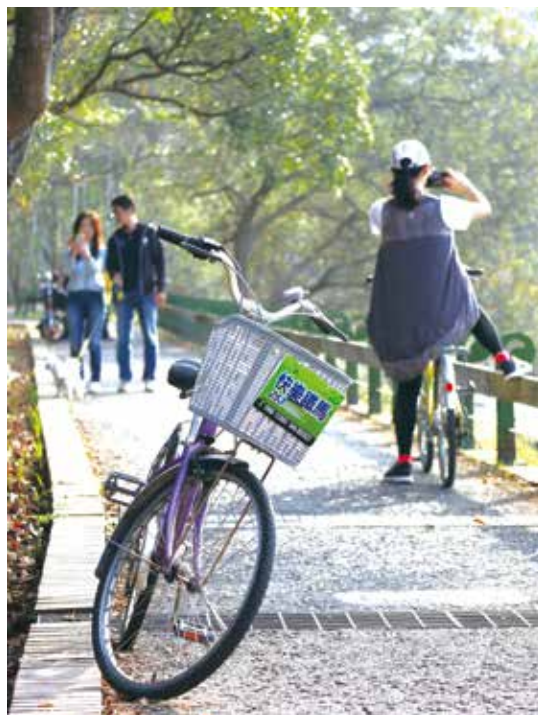
騎車賞湖景、散步休憩都很適合