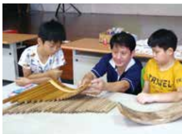
秀林國小竹排笛製作研習課程