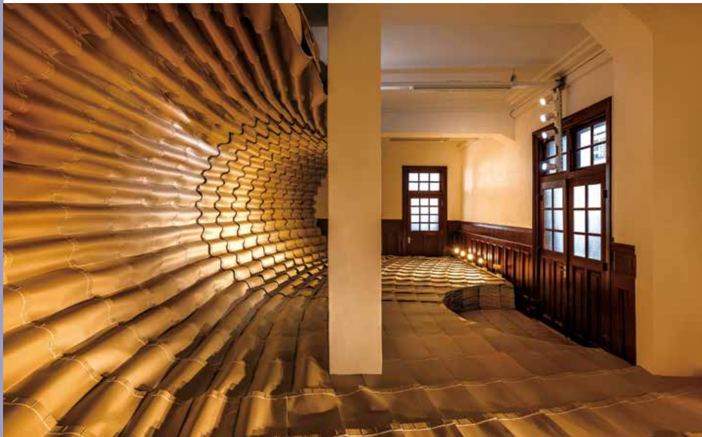
為百年歷史的新竹州圖書館所創作的空間裝置作品（展期至 2021 年 3 月 7 日）