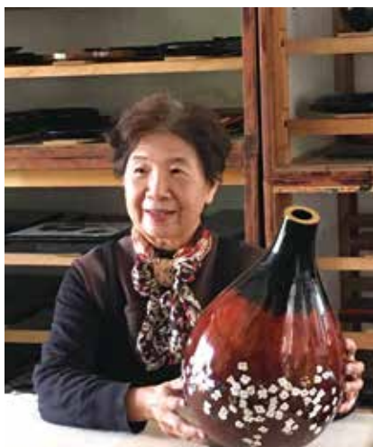
黃麗淑老師以漆工藝登錄為人間國寶的藝師

南投漆藝大師黃麗淑投入漆藝研究36年，日前榮獲文化部審議通過入選「人間國寶」，登錄為國家重要傳統工藝「漆工藝」之保存者，除了表彰黃麗淑藝師持續創作及研究漆工藝技法方面的貢獻，更肯定她教學傳習不輟的付出。