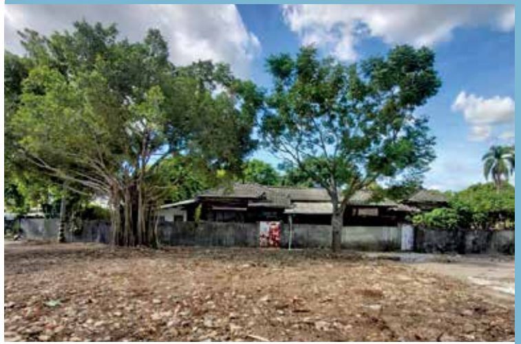
草鞋墩雅舍宿舍正面

而另「歷史建築草鞋墩雅舍」位於草屯市區，坐落在國立臺灣工藝研究發展中心對面轉角空地旁，前後分別鄰靠草屯戶政與地政事務所，原為農委會林務局南投林區管理處員工宿舍，住戶遷出後即無人使用至今。107年8月經文化局現勘，認定具文化資產價值，同時啟動相關文資審議程序，成功登錄為本縣歷史建築。惟目前該文化資產之土地鑑界分割作業尚進行中，文化局將儘速完成公告程序。