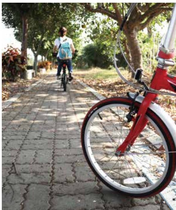
分隔清楚的單車專用道

在新民國小旁找到自行車道指標開始出發，長約 1 公里多的路段在投 44 鄉道旁設置專用道，特色是路旁種植的整排的波羅蜜樹，沿途還可看到水車、穀倉、牛車等具農村意象的陳設以及涼亭、公廁等設施。因為採取自行車道、人行步道雙線分隔並行的規劃，不僅在此騎車、散步都可以隔絕車輛，而且不會因行人與單車互相干擾造成危險。