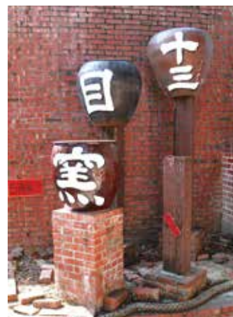
窯內改造成商店街