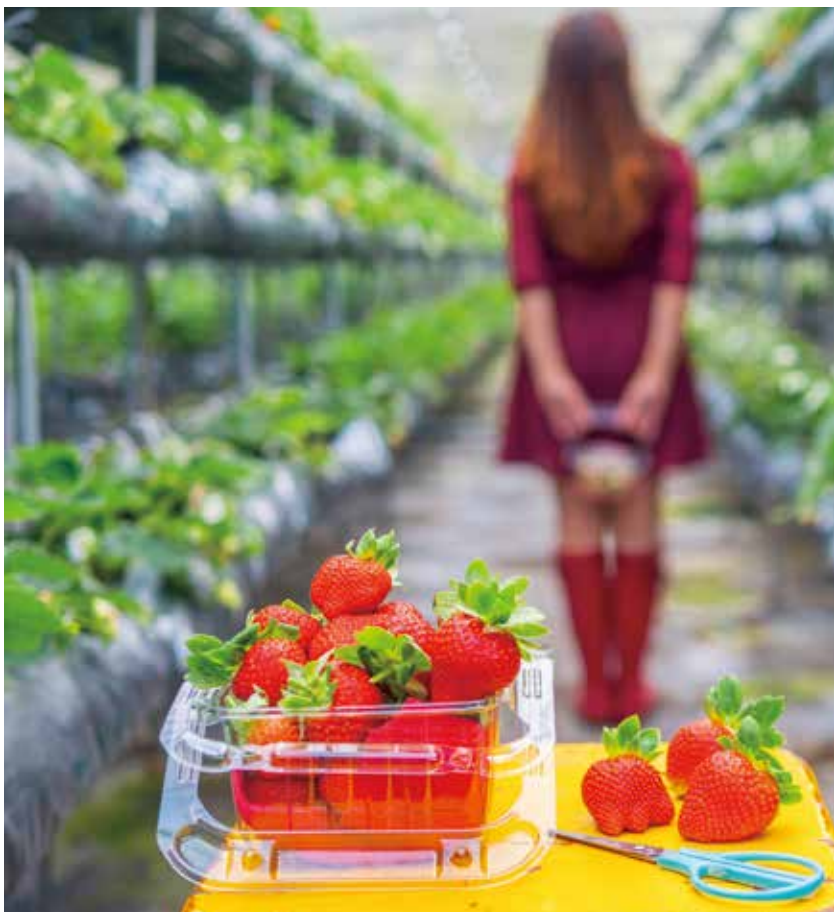
冬春季節可以採草莓