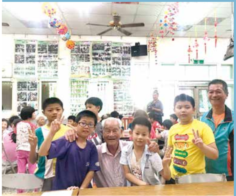
重視社區內老人與小孩的福利照顧

水保局自 92 年起每年補助社區進行環境景觀改善，讓社區煥然一新，更強化社區居民的信心，