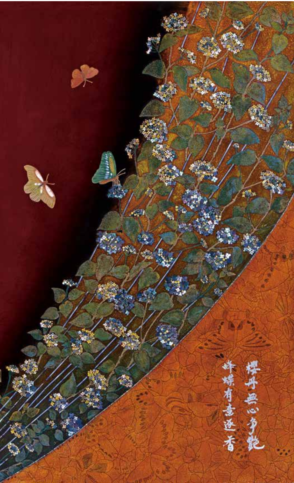
作品 / 自雍容