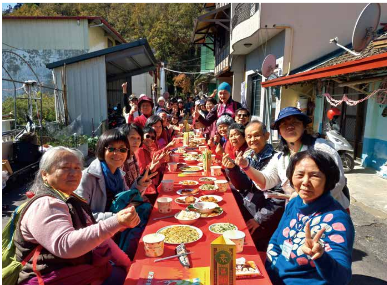
壽亭新村迷你長街宴體驗活動

南投清境農場地處海拔 1,750 公尺的高山，座落於群山之間，青青草原一望無際，地勢高、山境美、視野遼闊，翠綠的山光水色，令人心曠神怡，不僅可欣賞草原風光，還有趕羊秀表演以及花園、步道，是絕佳的旅遊勝地。