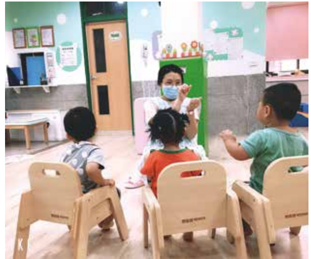
精緻小家園，師生比為 1:3，打造類家庭環境溫暖的袖珍型托嬰中心模式。