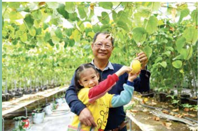
闔家同樂摘採百香果