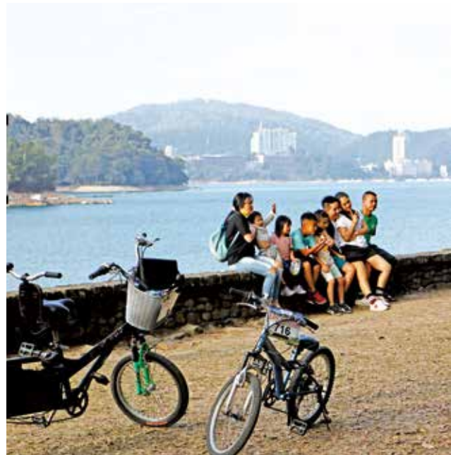
許多遊客都會在月牙灣拍照留念

來到遊客中心後方停車場的休憩步道，看到往頭社壩的路線指標開始出發，除了一開始遇到一段小陡坡之外，接下來多半是平路或下坡路段，但也預告著回程會稍微辛苦。沿線雖然指標不多，但就只有一條路線，路面也堪稱平順好騎，在經過頭社壩後來到月牙灣，前段水域是一個水上運動的訓練基地，接著就來到讓人驚艷的月牙灣後段，從這裡的觀景台望向日月潭別有另一種美感。