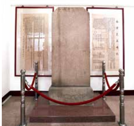
香火鼎盛的福興宮與廟中珍藏的永濟義渡碑