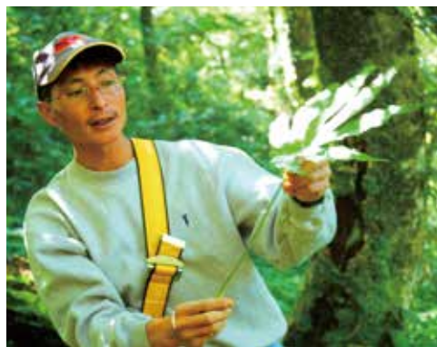
立鷹山原始森林步道生態體驗