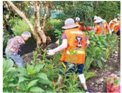
共同整理居住環境

民國 97 年起，教育部試辦「樂齡學習中心」，富州社區大膽承接竹山鎮樂齡族的教育工作，雖然做得很辛苦，也在 100 年得到全國優等，仍每年繼續辦理中。在歷年所舉辦的代間教育、祖孫週活動中，也都能展現優良的成果。