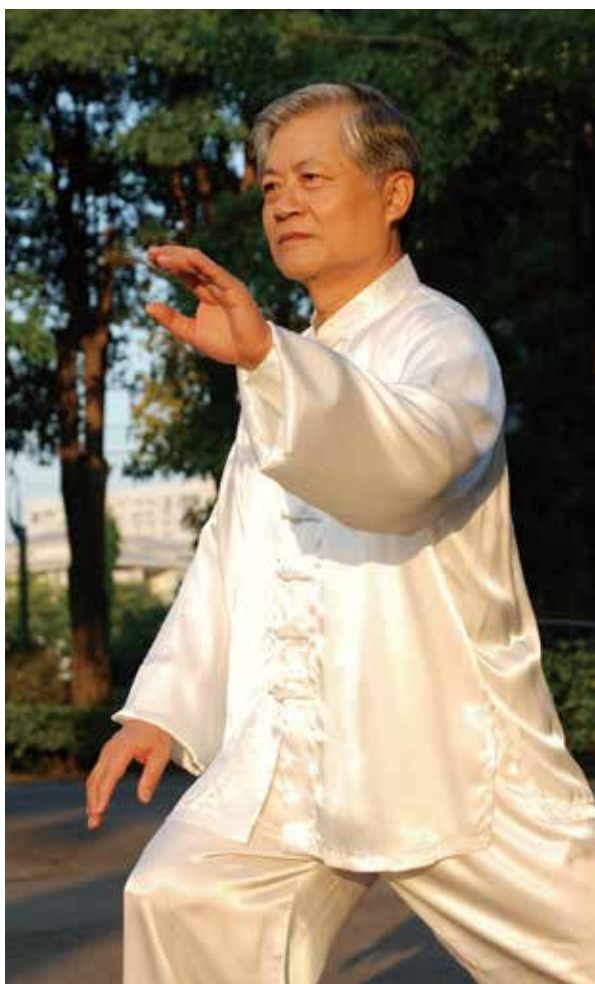
岩上老師精於太極拳，並曾開班教導