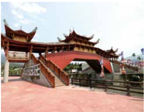
泰順廊橋這兩年吸引很多遊客參觀

來到集集就是要騎單車，如果擔心體力負荷的話，除了一般自行車車之外，業者還有親子車、協力車、三輪車等，現在出租電動單車也很普遍，讓遊客逍遙玩集集更輕鬆、更自在！