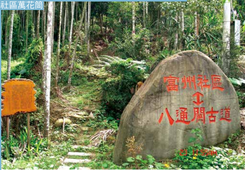
社區義工定期義務清理一段八通關古道