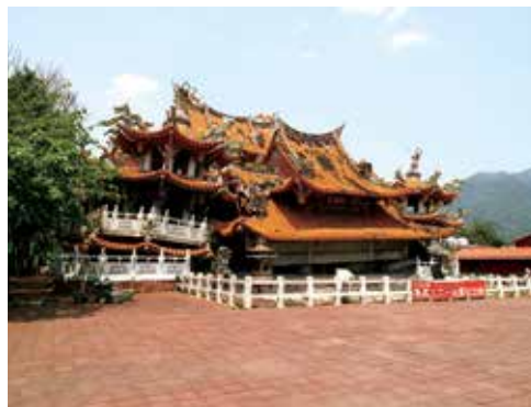
見證地震威力的武昌宮