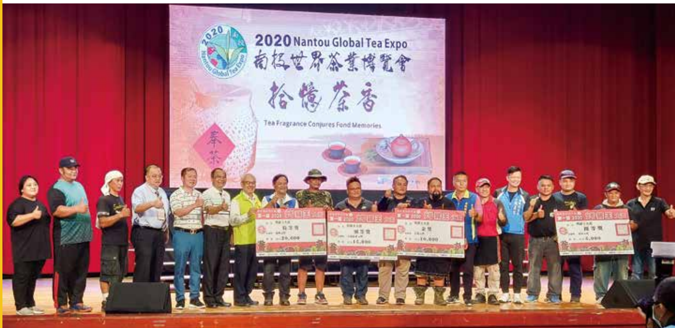
首屆得獎選手合影

南投縣原鄉包括信義鄉、仁愛鄉及魚池鄉，原住民擁有許多文化與技藝可以型塑發展為特色產業，其中「原住民烤大豬」就深具原民意象與市場消費潛力，南投縣政府也首創原住民烤豬認證制度，開創原鄉產業品牌通路。