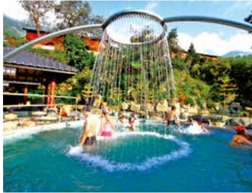
玉山腳下洗東埔溫泉

今年交通部觀光局推出「2020 脊梁山脈旅遊年」，鼓勵民眾前往各式步道健行，在東埔就有好幾條的健行路線，還可順道欣賞瀑布景色，舉凡可通往彩虹瀑布的彩虹步道，以及可抵達至雲龍瀑布的八通關古道等，在健行過後回到溫泉旅館泡個暖湯，也是許多遊客喜愛的行程之一，東埔線開通首月吸引了近一萬人次搭乘，隨著天氣逐漸轉冷，將再帶起一波泡湯旅遊熱潮。