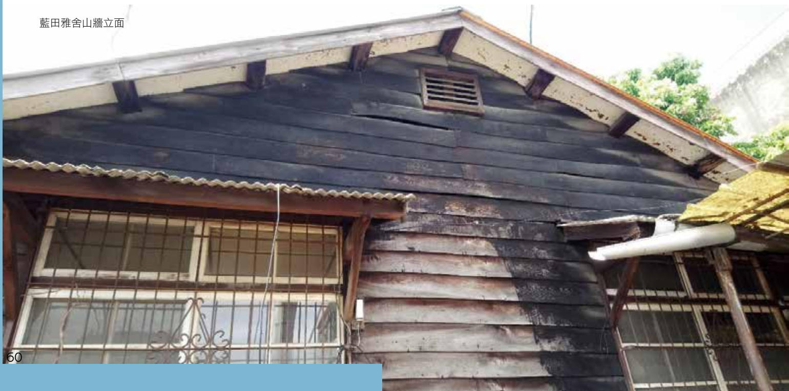
藍田雅舍山牆立面

南投，位於台灣中央，雖不靠海，但在大山環抱，和大河流淌之下，縣內孕育出有別於大都會的繁華，而是自然質樸、人文底蘊豐厚的各地市鎮，諸如南投、草屯、埔里、集集等地，皆能讓人深