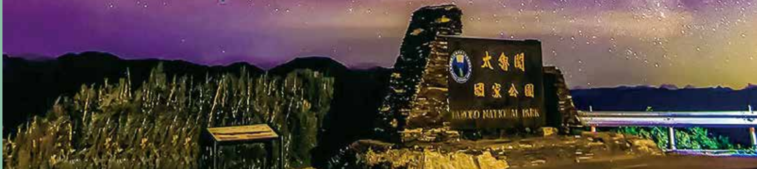
合歡山暗空公園壯麗銀河

南投縣政府為改善縣內觀光風景區的交通，並因應交通部觀光局所推出的「2020 脊梁山脈旅遊年」，今年八月份新闢兩條台灣好行路線—清境線與東埔線，期望這兩條台灣好行路線可以提升清境、東埔的觀光人次。