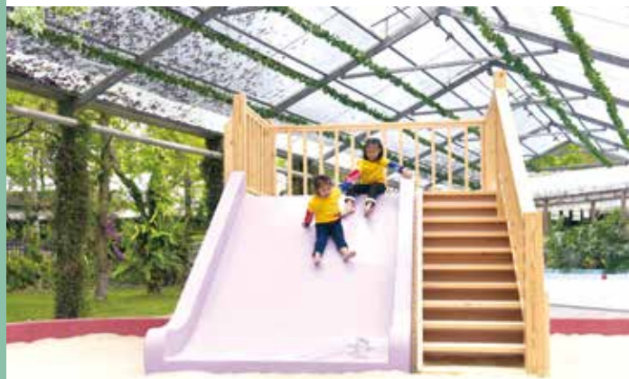
小朋友最開心的兒童遊戲區

為追求環境自然生態永續發展，今年8月設置的主題花海「蝴蝶迷宮」，種植了十幾萬株的蜜源植物，整座迷宮占三分地，走入迷宮小徑內，就可