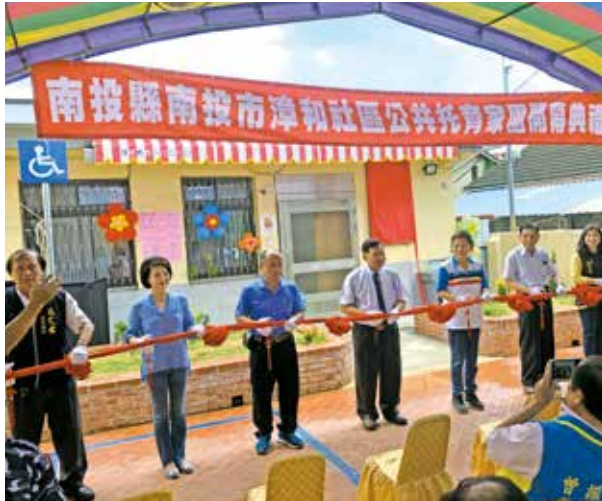
南投市漳和社區公共托育家園開幕剪綵。