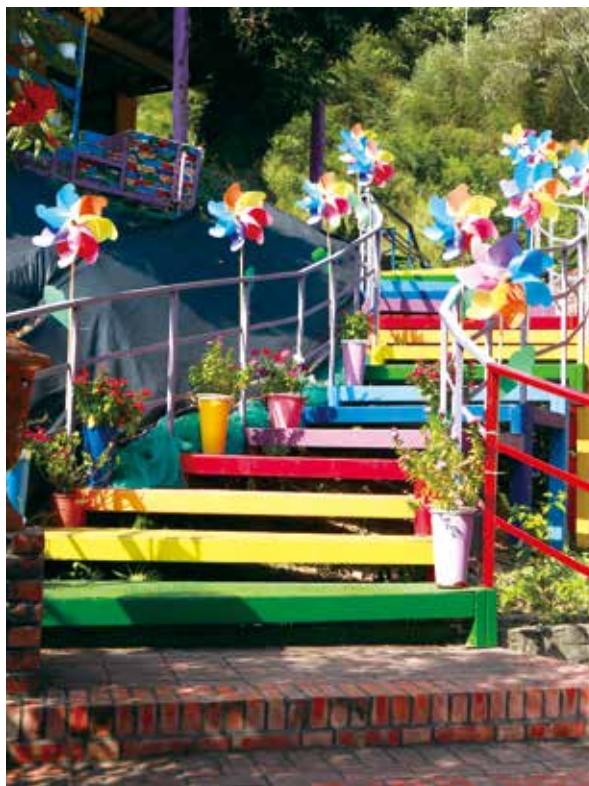
吸引遊客打卡的七彩階梯