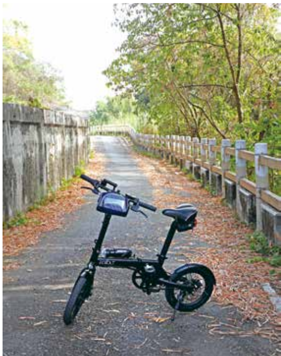
幽靜的鄉間小徑車道