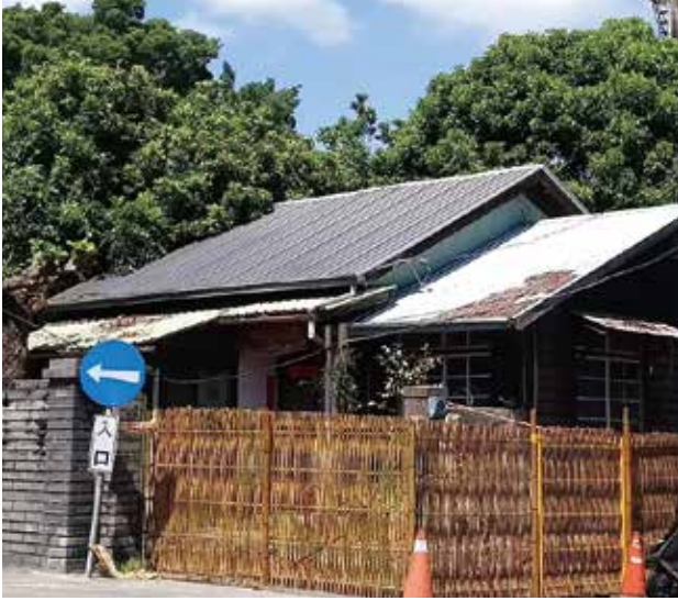
藍田雅舍外觀全景

度遊訪體驗。尤其近年本縣文化局深耕文化資產有成，陸續發現那些隱匿於市鎮的老屋，如藍田雅舍、草鞋墩雅舍，彷彿久未逢面的老友，在某個生命契機中相遇，終於又能呈現在世人眼前。