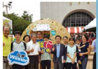
社寮國中師生共創「茶亭」大型竹編裝置藝術創作