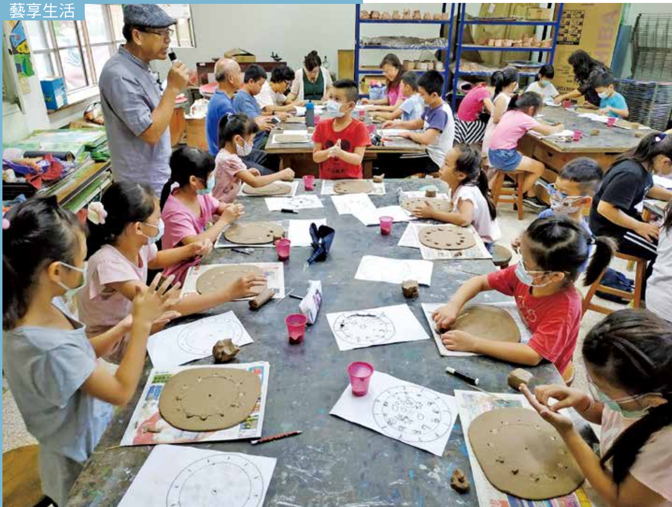
郡坑國小陶藝研習課程