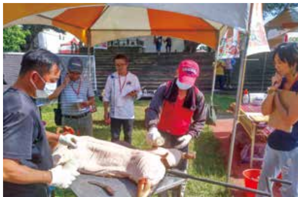
烤豬王比賽 3 名專業評審評分

首屆參賽隊伍計 10 組，共有 18 名職人組隊參賽，在激烈的賽事競爭，評審們依專業規範流程把