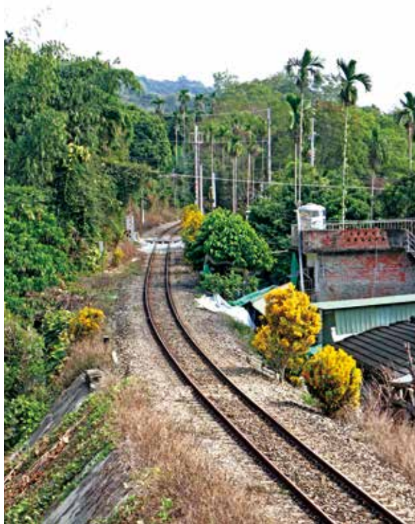
自行車道末段可以俯瞰集集線鐵道