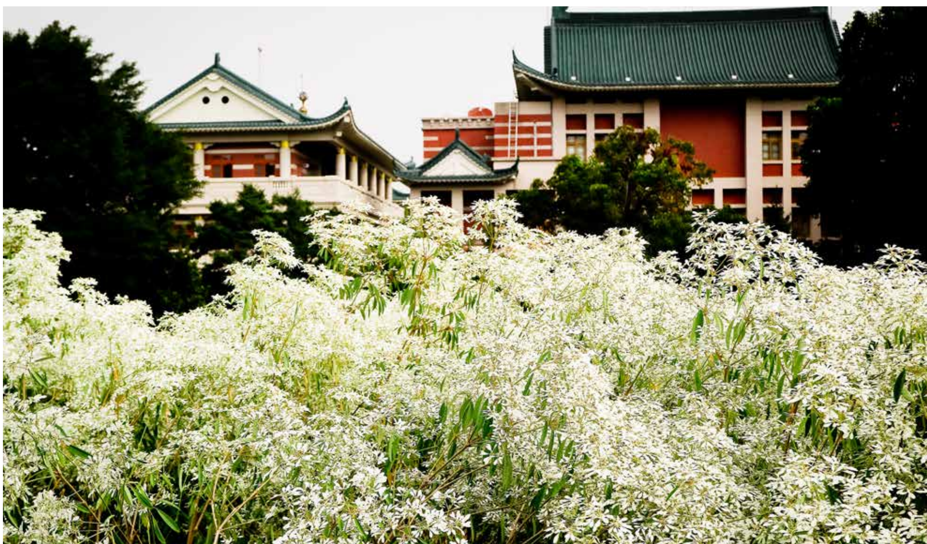
▲校園內的建築風格跟白雪木頗能融合搭配。