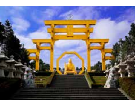
▲金碧輝煌的南天門。

除了拍照之外，易經大學內的建築與造景也很有特色，包括雄偉壯觀的金色「南天門」、高達 25 公尺的世界最高「鬼谷子」聖像以及 34.8 公尺高的「九龍柱」等，都很容易吸引訪客的目光，還有兩旁有成排神佛石像、石燈的走道，以及大面積灰白色調的校舍建築等，低調沈穩中散發莊嚴氣息。校園內綠草樹木廣布，可以遠眺