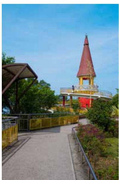
▲猴探井遊憩區的尖塔地標。

聖誕節將至，南投市郊區的八卦山麓也有白色美景閃亮登場，免門票、超好拍，距離國道三號交流道僅需 10 分鐘車程，交通便利又可以隔絕塵囂，還可以前往猴探井風景區順道遊，安排一日遊行程剛剛好。