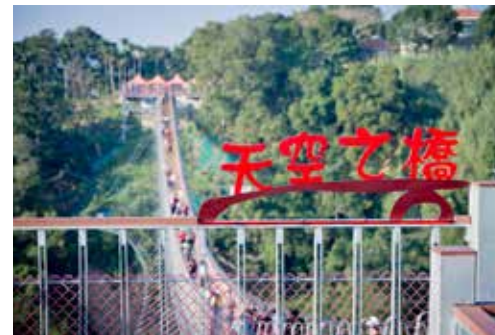
▲南投市八卦山天空之橋。