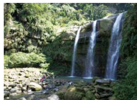
▲通過天梯後可順道參觀青龍瀑布

與人文產業完美相融。除了天梯、八卦茶園，還可串連紫南宮和溪頭、妖怪村、杉林溪等景點，帶給您一趟豐富又多樣趣味的完美旅程。