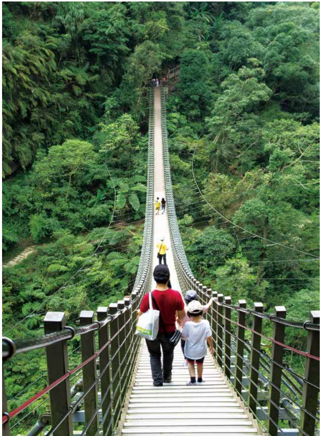
▲竹山天梯是台灣第一座觀光梯子吊橋

歷經兩年多的閉園整修，竹山天梯園區於 11 月 7 日正式重新開園，由於正值國內疫情趨緩、旅遊逐步解封之際，全國第一座觀光吊橋的弧線之美，以及太極峽谷鬼斧神工般的山水地形美景，就是您假日出遊、走向戶外的最佳選擇。