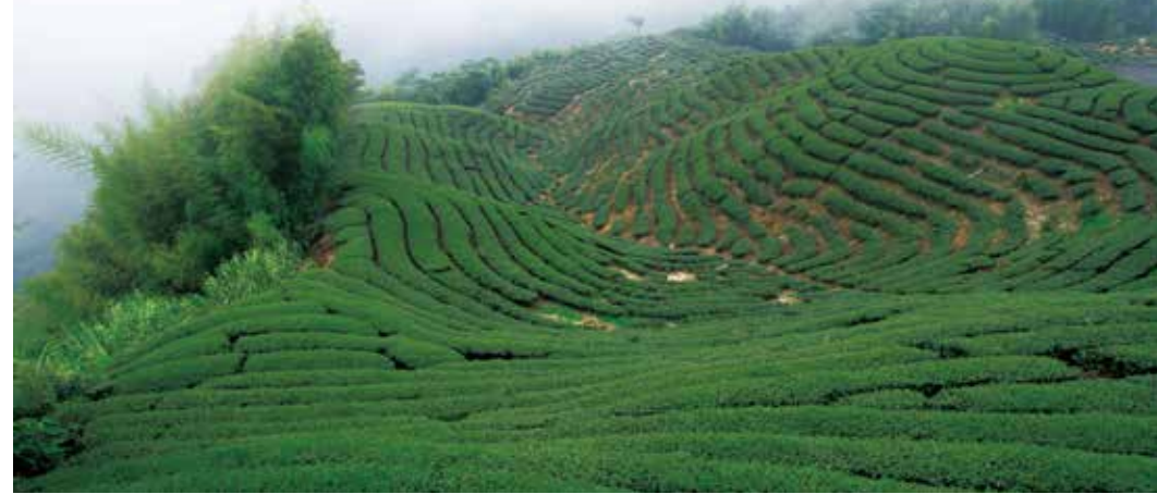
▲八卦茶園常見雲霧繚繞，更增添一番柔美氛圍。