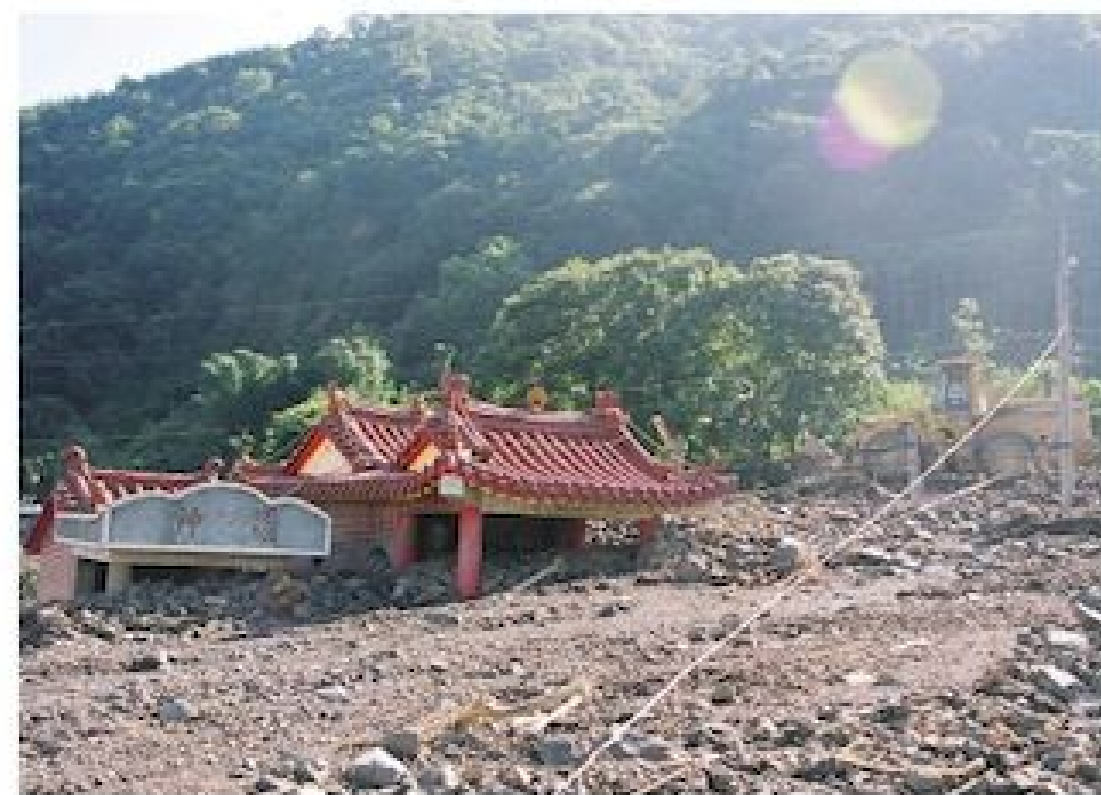
信義廟宇曾遭土石流掩埋

3月23日深夜地牛翻身。清晨1時41分，花蓮發生規模6.6地震，相隔2分鐘、1時43分又發生規模6.1餘