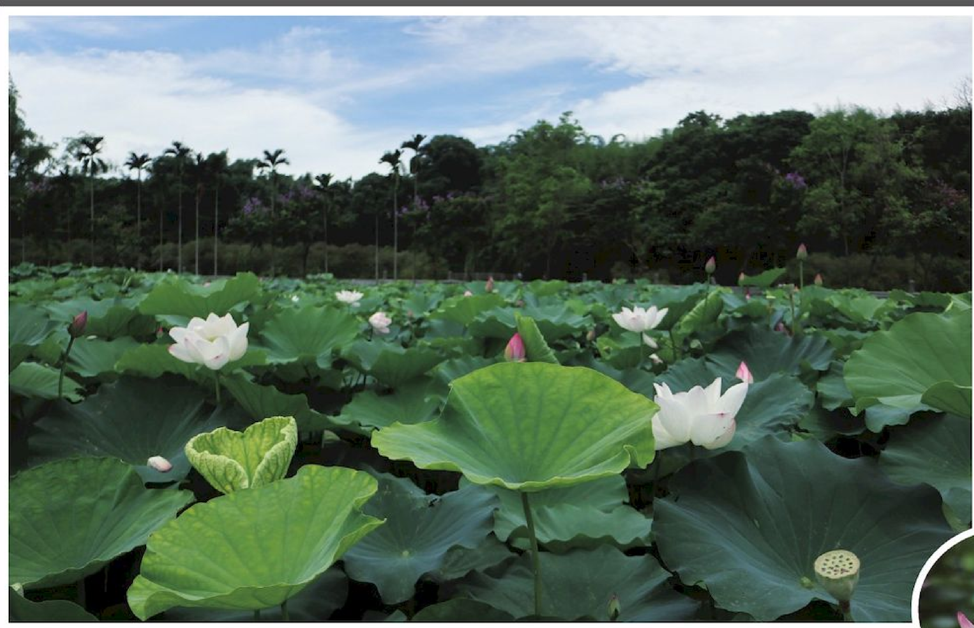
▲迎風搖曳的荷葉中，一朵朵荷花展現嬌容迎賓。