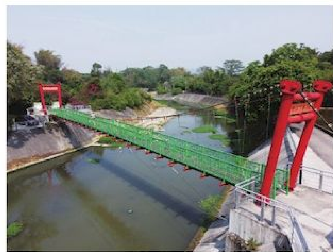
▲下坪吊橋是此處的地標

用更寬廣的視野欣賞水面風景，經常可見水鳥在此低飛覓食。公所種植的荷花田就位於吊橋東側的農地上，一朵朵荷花紅、粉、白的花朵相互爭豔，高度都超過半個成人身高，中間還有一條小路可以走入近距離欣賞，不管是拍攝花朵的特寫，或是想要置身花海合影都很方便，不需專業器材、不用長距離鏡頭，只要用手機就可以拍出喜歡的打卡美照。