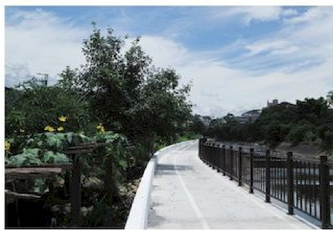
▲新增建的延伸車道已經完工開放