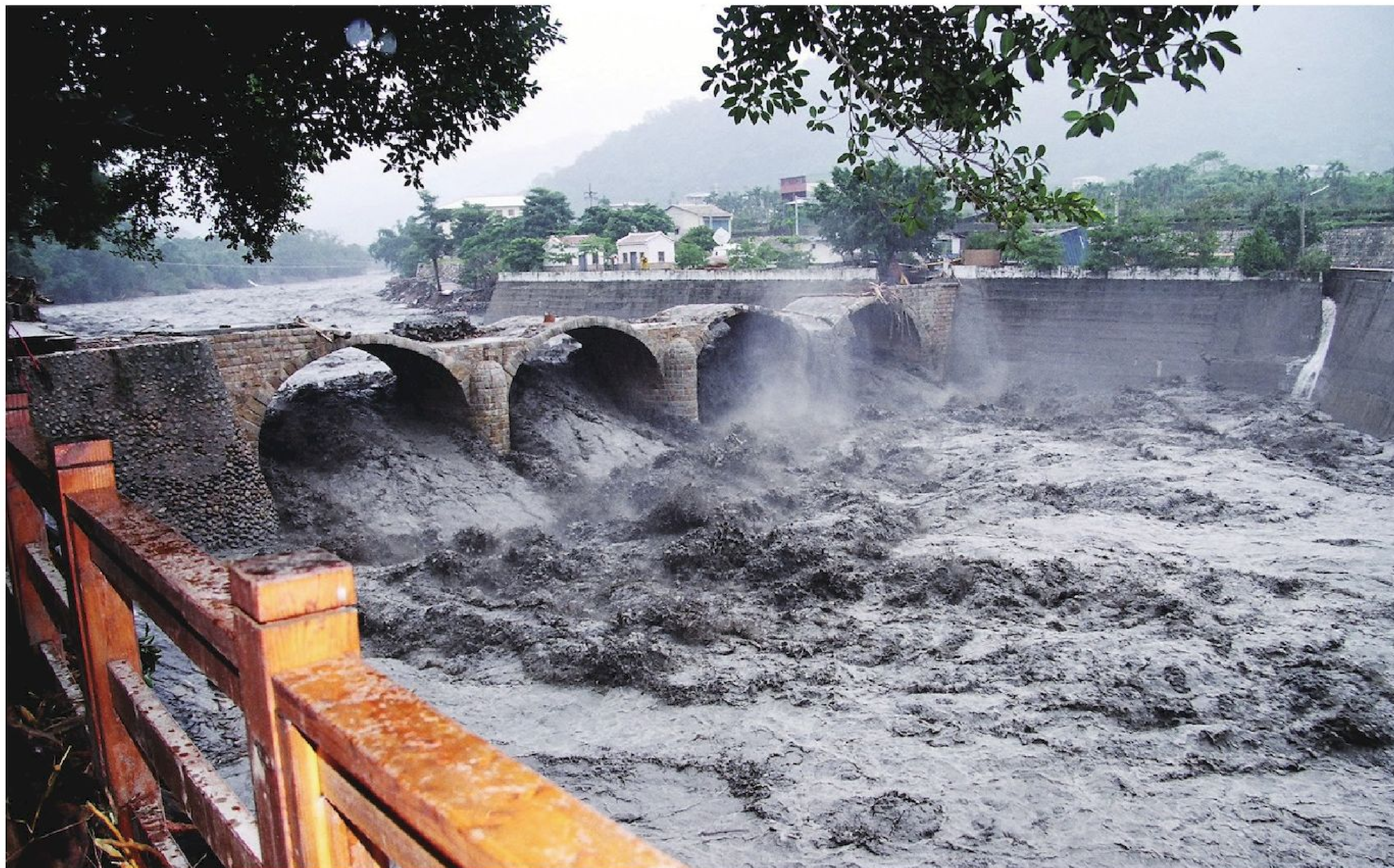
七二水災，國姓糯米橋被水淹