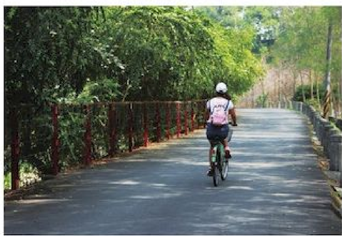
▲下坪自行車道路面平坦好騎