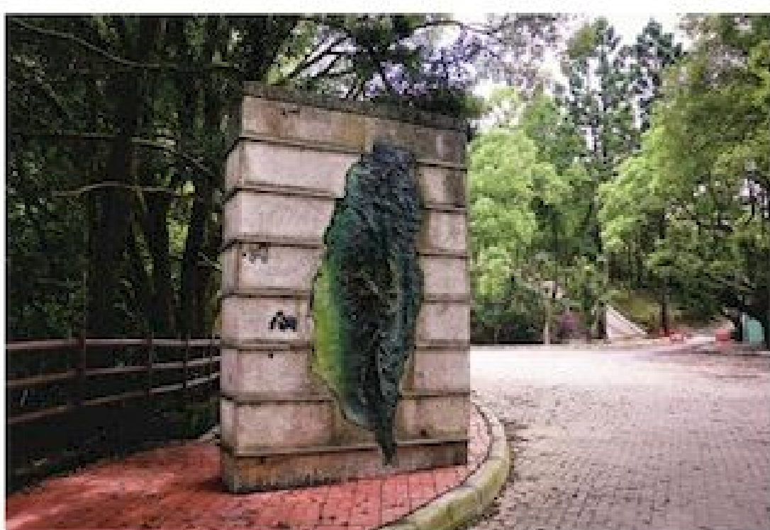
▲另一側步道停車場也設有主題意象