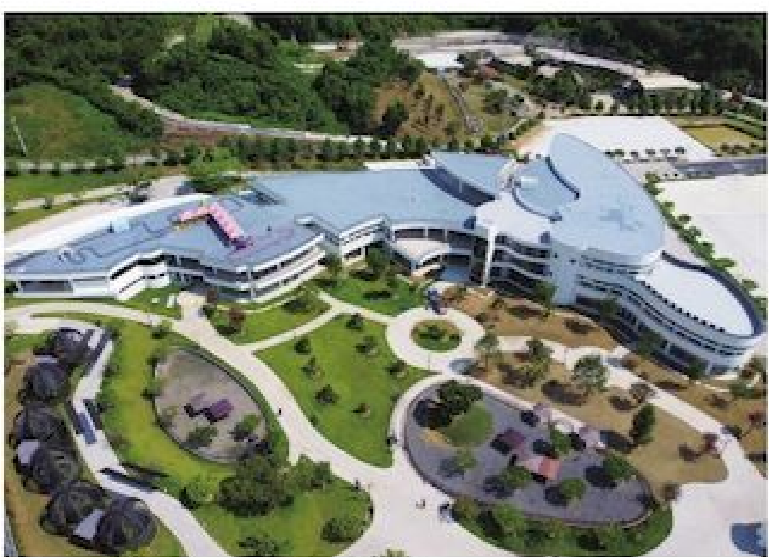
台灣多一處動物園了！佔地近 20 公頃的草屯鎮「九九峰動物樂園 (JOJOZOO PARK)」，第 1 期工程已

經完工，預計 8 月正式營運，園區內有 4 座大型天網鳥籠，是亞洲規模最大的鳥類主題動物園，還有宛如電影「侏儸紀公園」場景，將提供遊客耳目一新的觀光體驗。