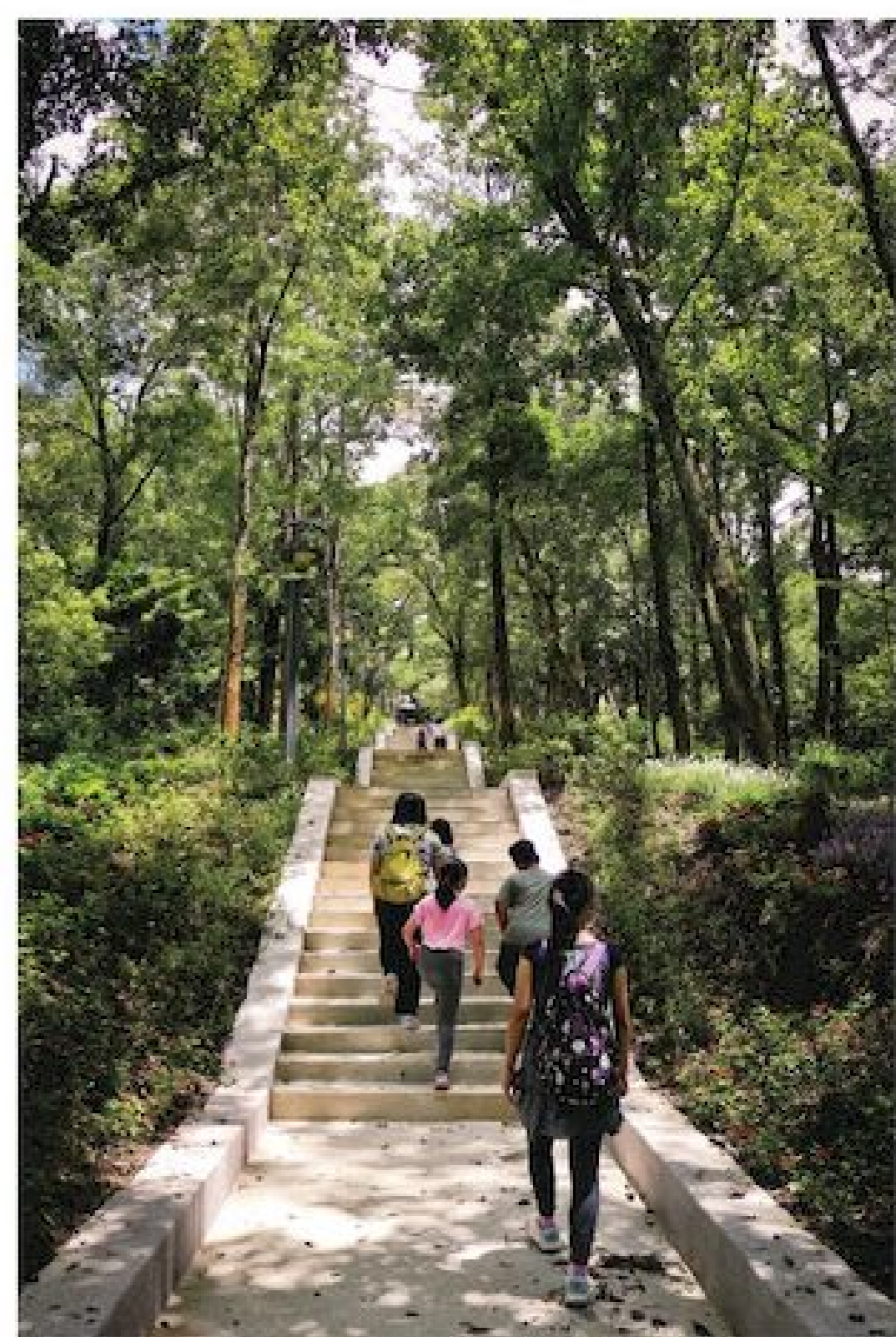
▲鋪設完善的階梯步道老少咸宜

尺的虎頭山頂也是相當著名的飛行傘體驗場，在氣候與風向適當的日子裡，就有機會可以體驗飛行傘的樂趣，不敢嘗試的話也能在此欣賞飛友們滑翔的英姿。從飛行體驗場可以通往一條串聯鯉魚潭的登山步道，日管處也推動步道暨周邊景觀改善工程，讓遊客享受更安全舒適的休憩體驗。