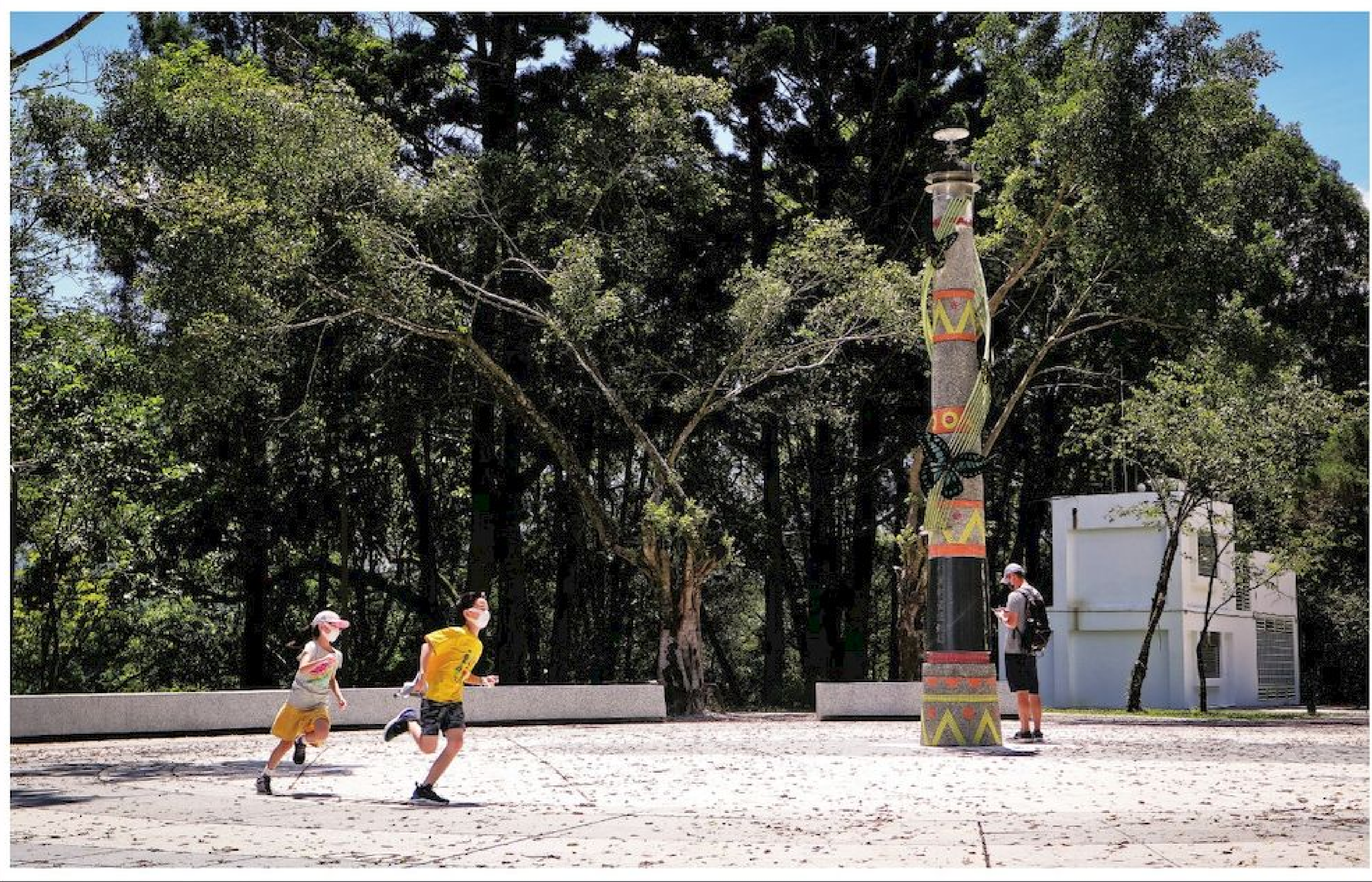
▲全新的地理中心碑與圓形廣場