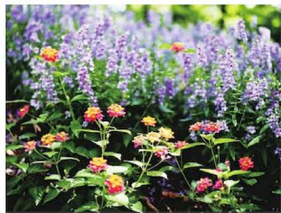
▲周邊樹木茂密，花卉栽植營造美麗景觀。