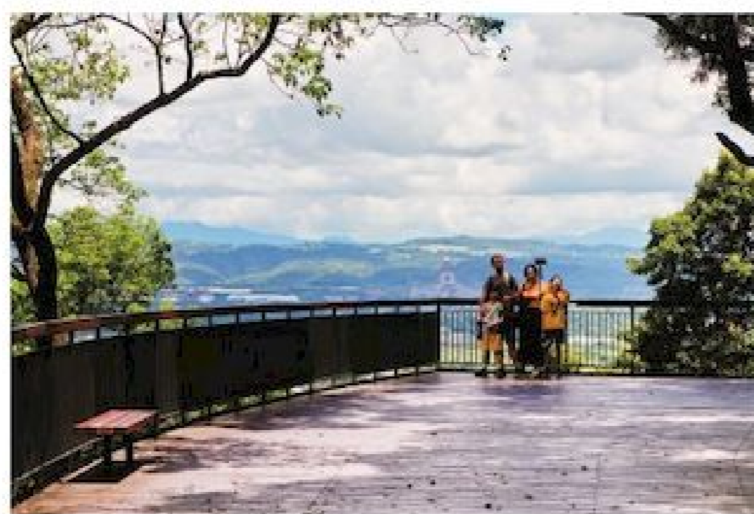
▲更高的新觀景台視野也更好

交通部觀光局在 109 年將埔里鎮虎頭山風景區內的地理中心碑、虎頭山、地母廟等知名景點，劃入日月潭國家風景區的管轄範圍，並投入經費與資源改善遊憩設施，其中地理中心碑園區的整修已於日前完工啟用，重新打造的觀景木棧道平台視野開闊，可以居高臨下飽覽埔里的好山好水美景。