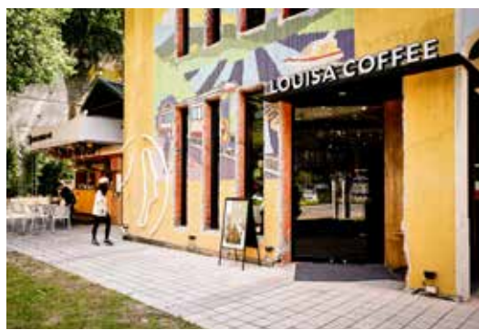
▲路易莎咖啡館保留原校園的馬賽克牆

立新車埕遊客中心及管理站辦公室，整體校園空間與建築則進一步活化設置主題展示館暨林班道鐵路小學商場，以擴大旅遊服務能量、為舊校舍注入新活力。