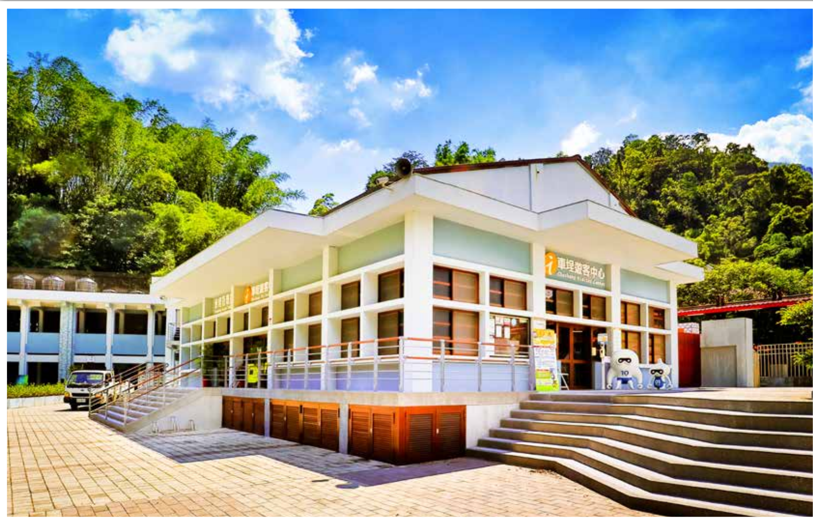
▲車埕國小舊禮堂改建為遊客中心