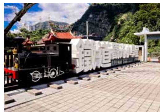
▲車埕鐵道觀光小學堂大型入口意象

沿著戶外的旋轉梯走上二樓的藝文展覽空間，規劃了常設展、主題展與生活美學館，除了讓遊客感受集集線鐵道的歷史風華，這次還看到「日月潭永續展—未來借物所」、「日月潭攝影展—向祢借一片景」，引領民眾欣賞日月潭之美，更體會日管處永續經營日月潭的用心。