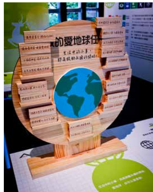
▲結合車埕木業特色元素製作的展覽設計

車埕是南投觀光鐵道風景線上熱門景點之一，鐵道觀光小學堂讓舊校舍發揮全新價值，開幕後馬上成為許多網紅打卡分享的新亮點，未來也將舉辦更豐富的展覽與活動、引進更多的優良廠商，來到車埕除了走訪木業館周邊商圈，到小學堂逛一逛、喝咖啡，更能夠感受那一份屬於車埕的獨特美感！