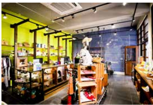
▲特色商場已有業者進駐