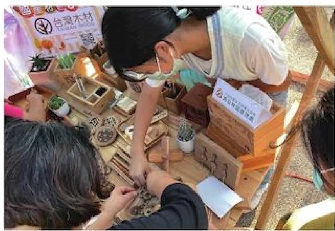
▲南投林管處攤位讓遊客用木材體驗手作

為了推動維護山林環境的部落生態旅遊，信義鄉濁水溪畔的「丹大布農生態旅遊協會」在地利旅遊資訊站廣場規劃「Dauk Dauk 撈撈客 Chill 市集」活動，並於 10 月 29、30 日兩天辦理試營運，共有 12 家當地的農家、布農族手作體驗、遊藝活動的攤位加入，吸引不少民眾參加。