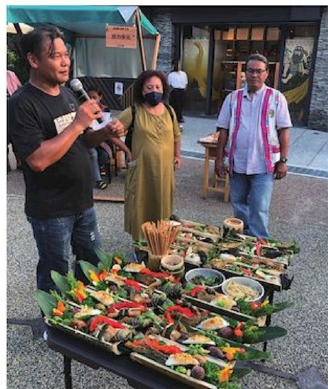
▲融合在地農特產的原住民風味美食

錯過這次活動也沒關係，DaukDauk 撈撈客 Chill 市集在今年度還有另一次試營運日期—12 月 24、25 日兩天，