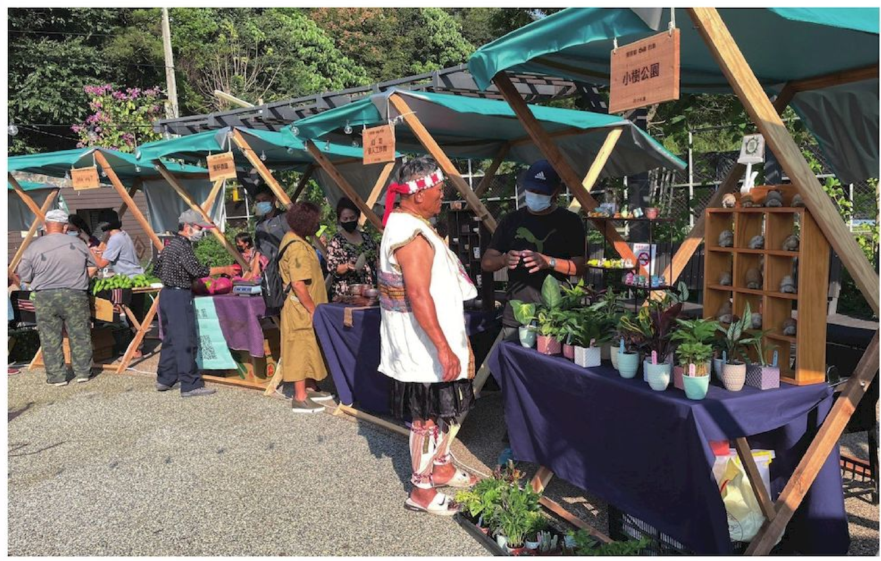
▲本次市集共有 12 個攤位共襄盛舉