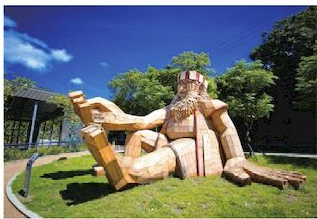
▲布農耆老巨人像吸引遊客拍照打卡