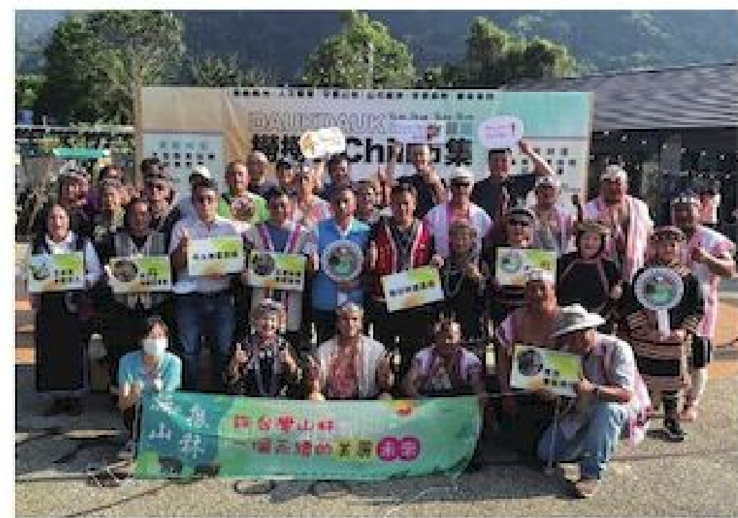
▲各界來賓聯袂為活動進行啟動儀式

同樣在地利旅遊資訊站廣場登場，活動時間為周六下午 2 點至晚上 7 點、周日上午 10 點至下午 4 點，歡迎大家一起來共襄盛舉，度過歡樂浪漫的耶誕節週末假期！