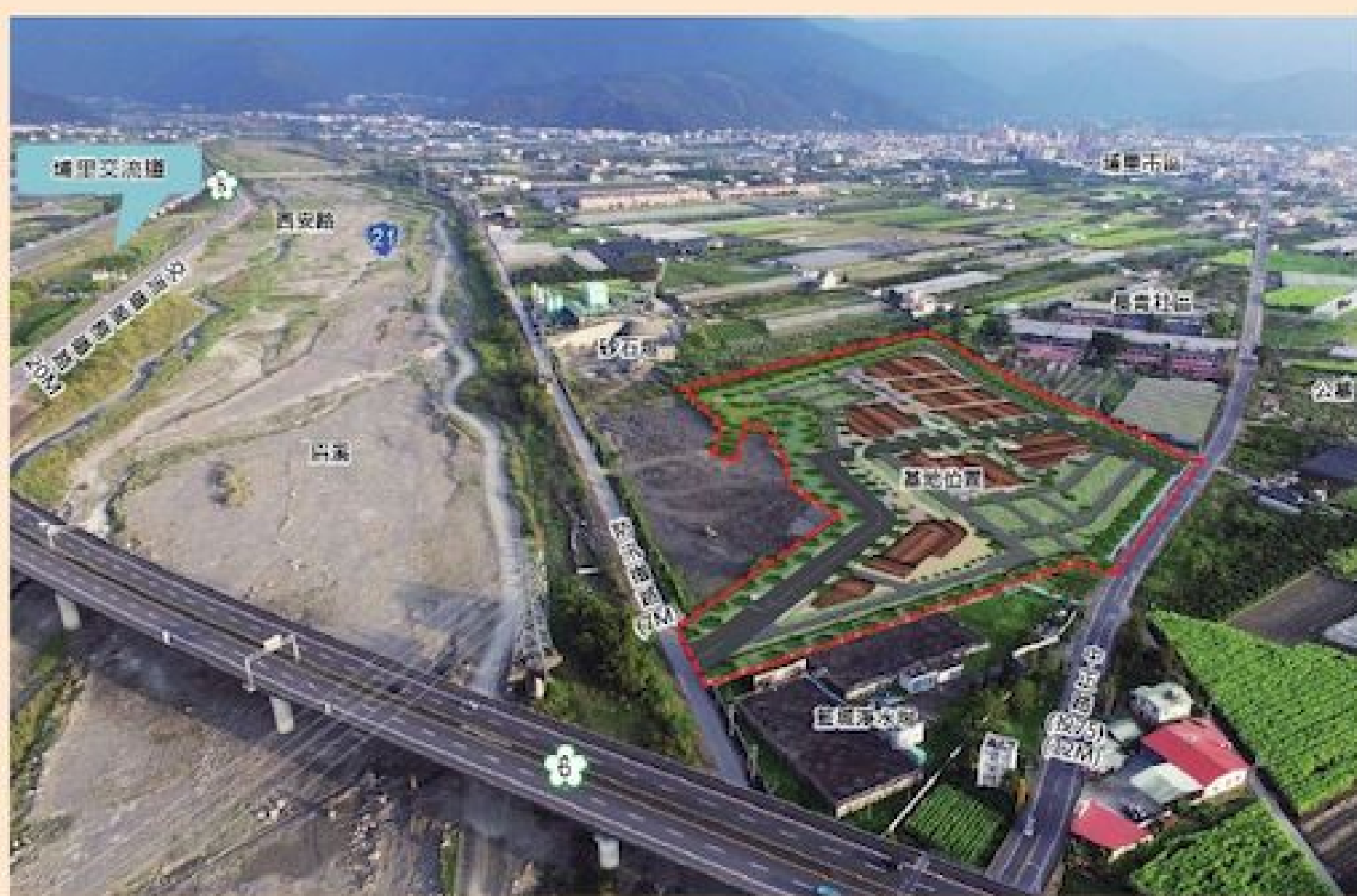
縣府投入 7 億 7 千多萬元，開發埔里地方特色產業微型 園區，並於 108 年 5 月完工，打造南投縣第一個觀光工廠

產業聚落。 埔里地方特色產業微型園區面積 5 公頃。其中產業用地約 2.47 公頃，8 塊土地，已銷售完畢。且知名廠商也將陸續進駐。 這些廠商包括「川武食品(大漢豆腐)」、「妮娜有限公司(妮娜巧克力)」、「美淳香料公司」、「金都花園餐廳」、「埔坊文創事業」，並將帶動地方就業，約可提供 300 人就業，年產值約 8-12 億元。