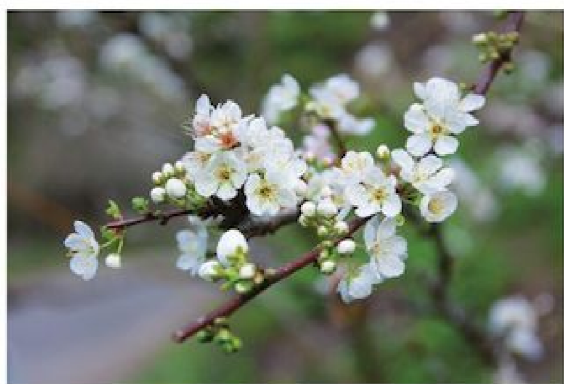
▲除了信義鄉，水里、仁愛也有多處賞梅秘境。

當時序進入 12 月，也代表 2022 年即將接近尾聲，隨著疫情趨緩、旅遊復甦，除了需要仔細規劃的出國旅行之外，在台灣擁有「觀光首都」美譽的南投縣，就有許多屬於冬天的經典賞遊主題，適合您隨時安排一趟簡單幸福的冬假期。