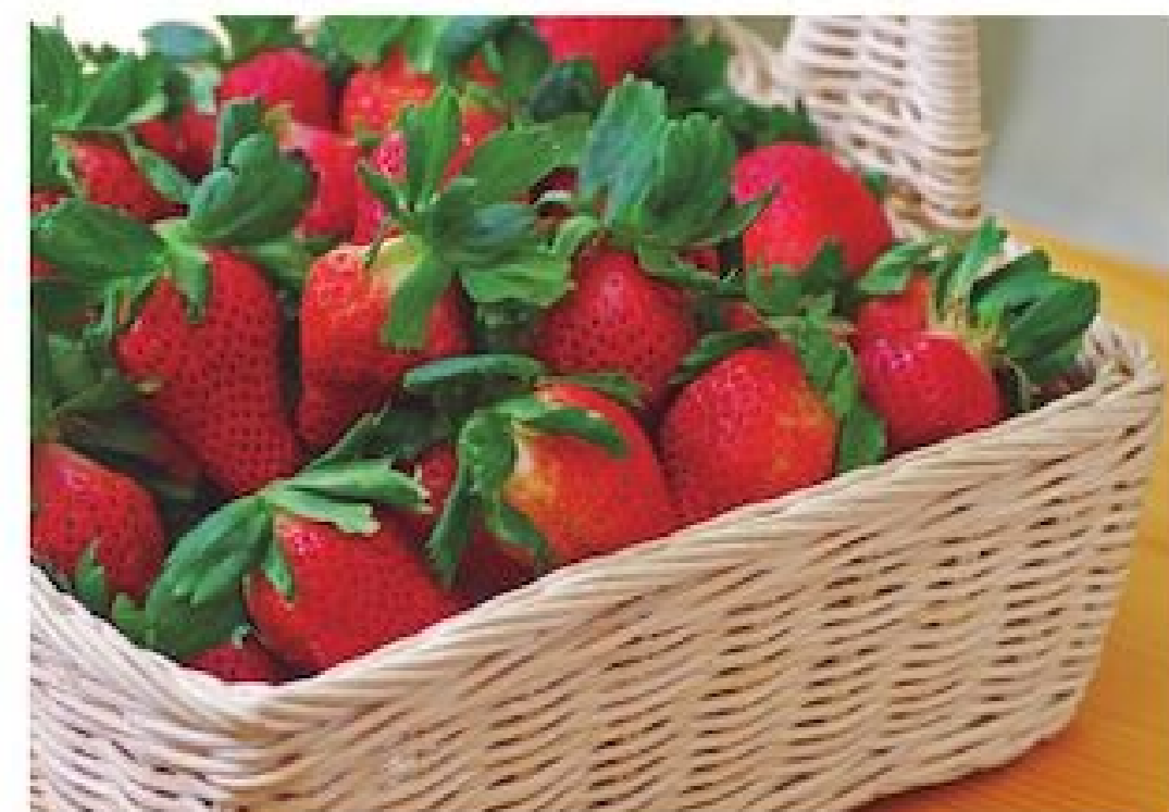
▲各界來賓聯袂為活動進行啟動儀式

收可達 3 期，12 月至翌年 1 月也是盛產季節，果粒碩大葡萄香氣撲鼻、汁多味美、口感極佳，大口品嚐之餘還可享受親子採果體驗。