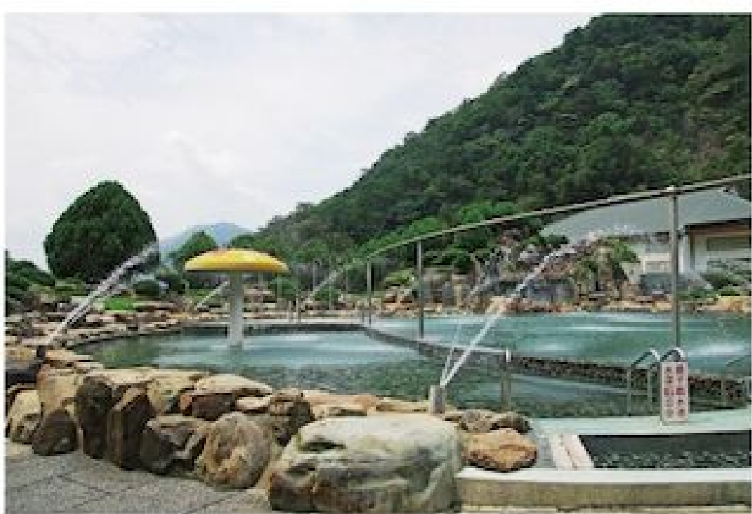
▲戶外池的 SPA 設施提供不同的溫泉體驗