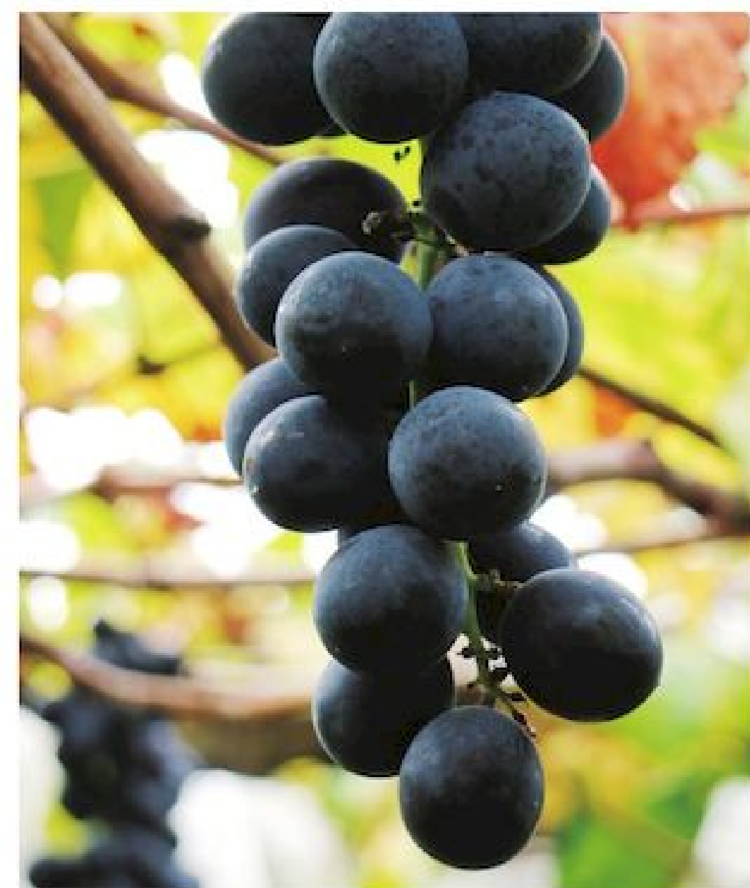
▲信義鄉種的葡萄品質堪稱台灣第一

同時在冬日登場的還有賞梅盛會，大約 12 月中到翌年 1 月中是信義梅花盛開的時節，信義鄉的三大賞梅聖地——風櫃斗、牛稠坑、烏松崙，總能吸引滿滿遊客，而水里鄉、仁愛鄉也都有熱門賞梅景點。信義豐丘的巨峰葡萄在台灣也是首屈一指，一年採