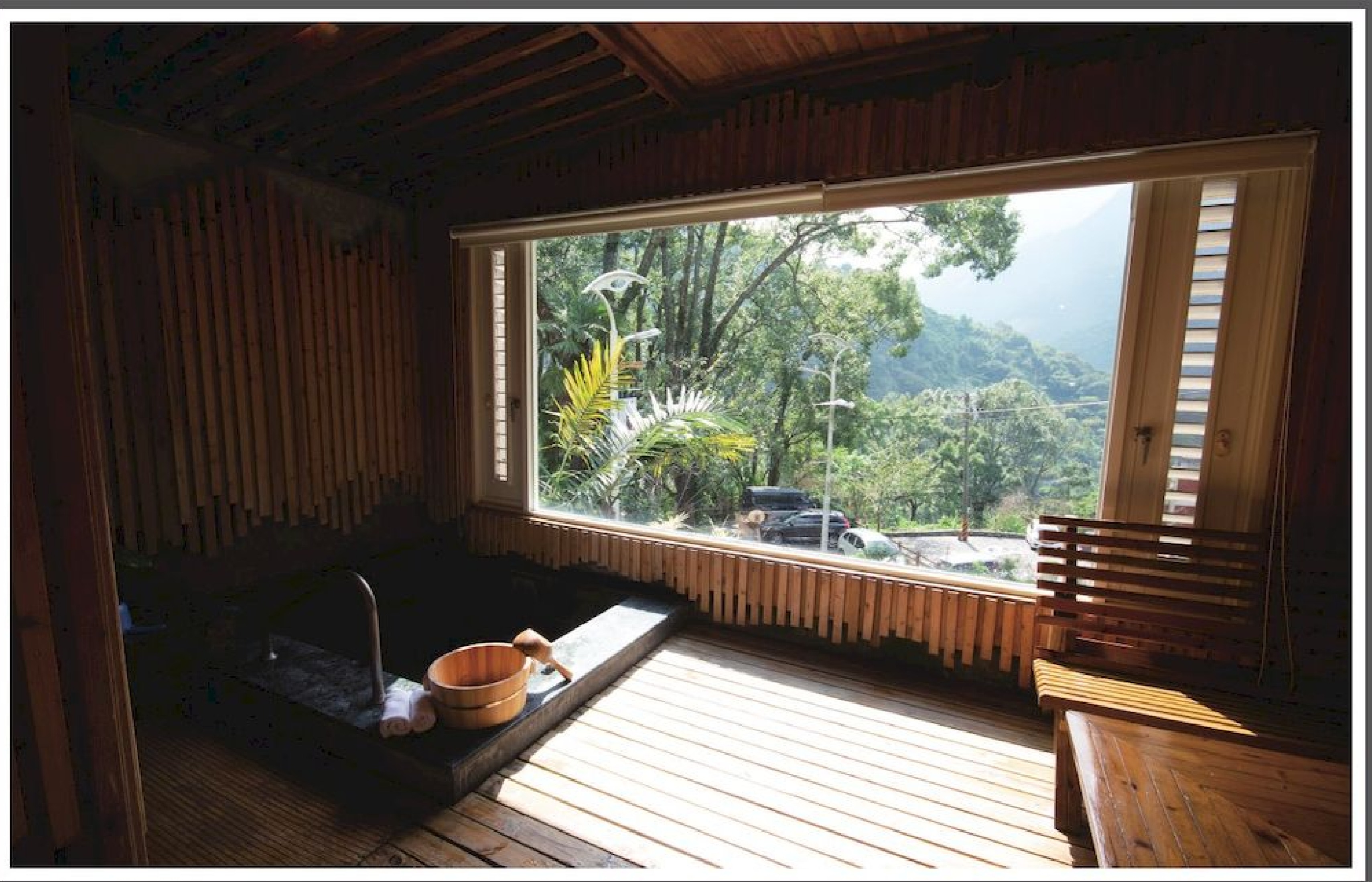
▲冬天泡湯的感覺就是很幸福