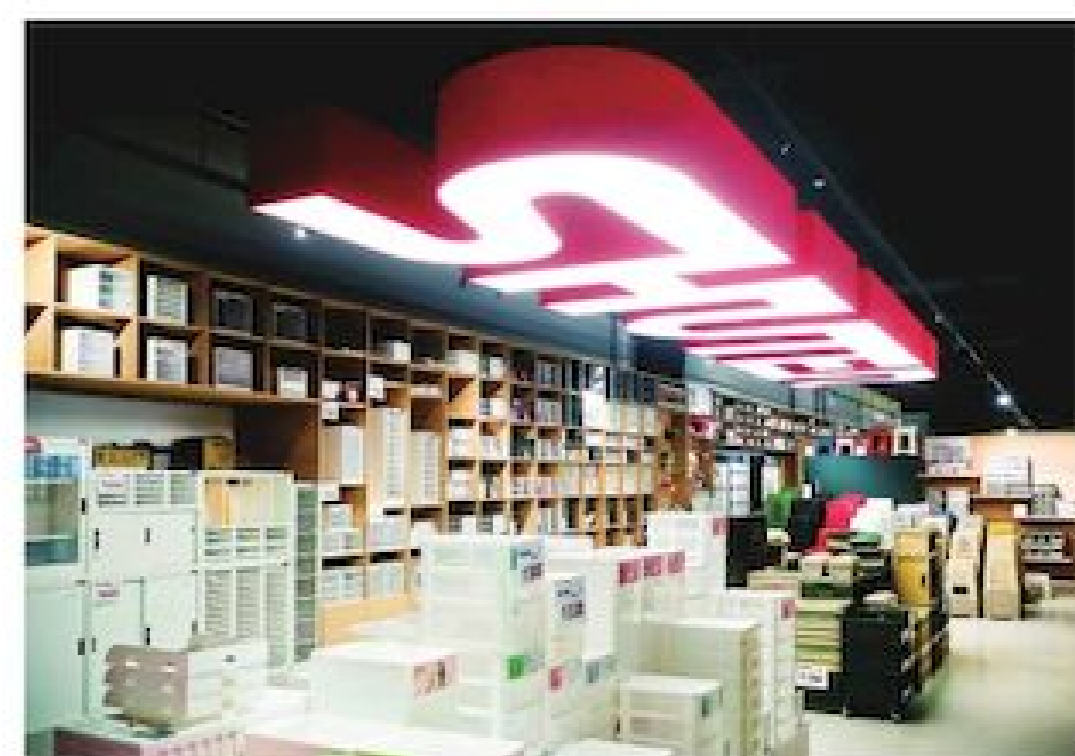
▲位於 8 樓的「樹德收納品牌館」展示全系列、全品項的優質產品。