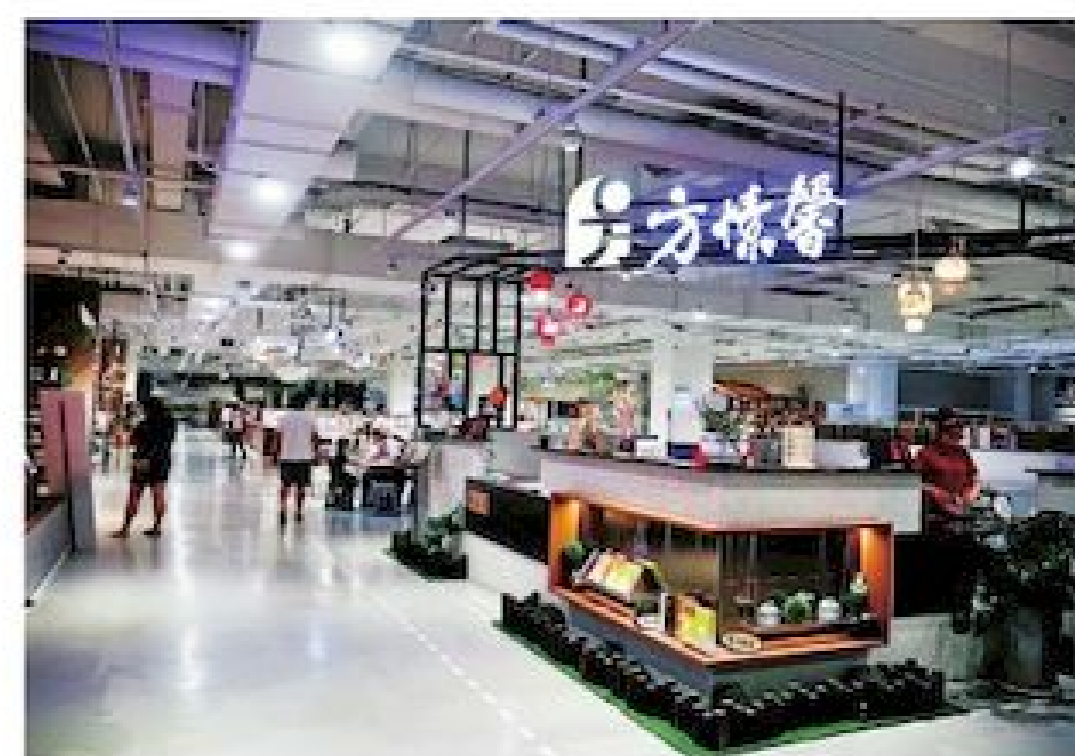
▲南投本地知名的「方標薯手工麻糬」也受邀進駐賣場內設櫃

南投市工業南六路 6 號 049-2009666 10:00-18:00 (週二公休)