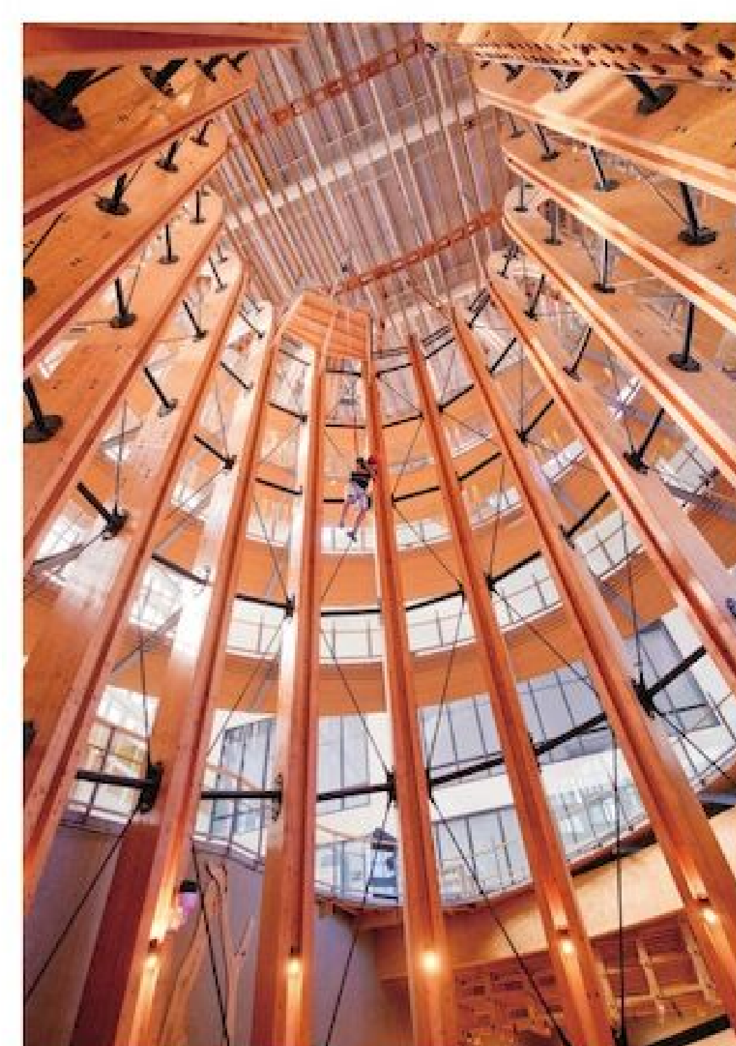
▲有興趣可以進行「樹心跳到底」挑戰，體驗從生命樹上端 10 秒垂降的刺激快感！