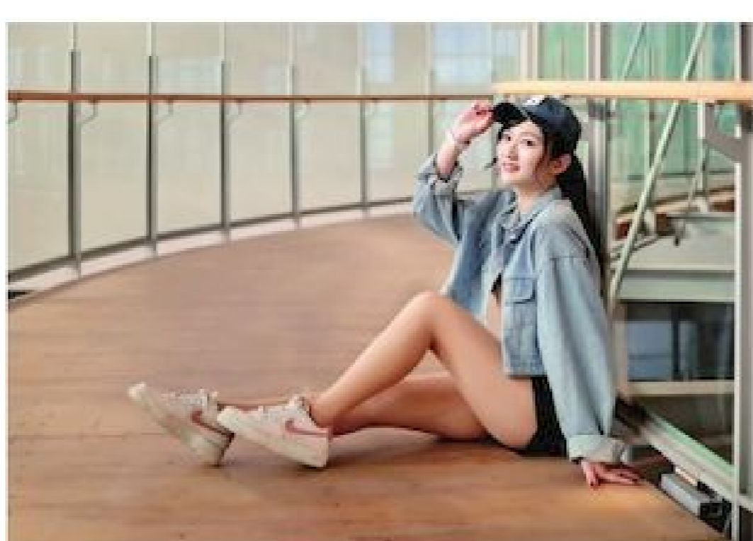
▲光線透亮、線條鮮明的生命樹步道，每一段都有不同的拍照打卡場景。

積廣達 5,000 坪，開放的空間為 G 樓、1 樓、8 樓，除了「樹德收納品牌館」之外，更打破一般觀光工廠只賣自家商品的侷限，規劃了寬敞舒適賣場空間，廣邀具有特色的本土品牌、業者進駐，商品服務包羅萬象，而且絕對都是地道 MIT 優質廠商。