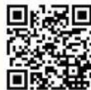
貓羅溪社區大學 Facebook粉絲團