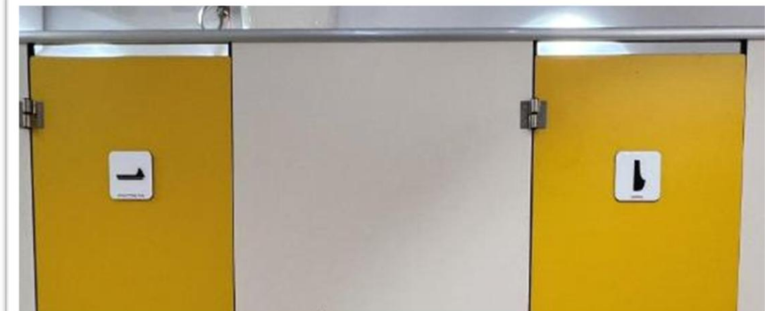
清楚標示、採獨立隔間設計，門板延伸至地面