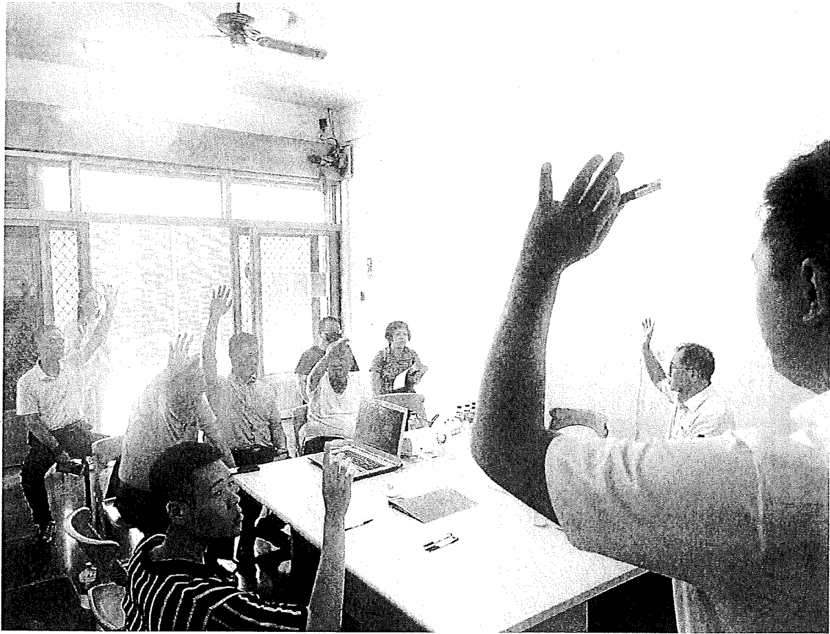
南投縣水里鄉水里溪南側自辦區地重劃會第二次理事會照片