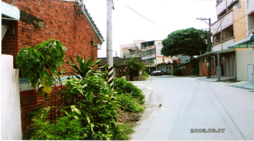
NO.8 邊界排水（道路）-施工中