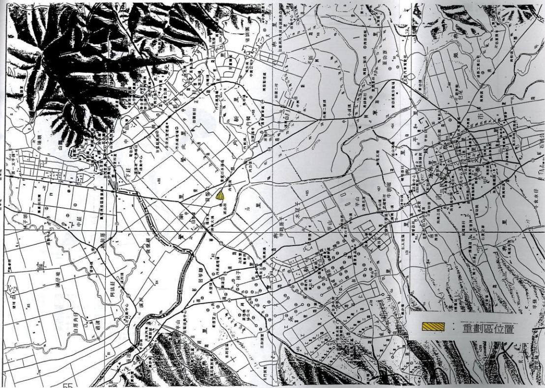
圖 1-2 南投縣南投市營南里營南農村社區位置