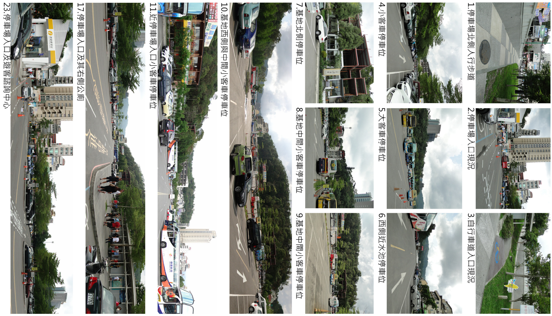
1. 停車場北側人行步道 2. 停車場入口現況 3. 自行車道入口現況 4. 小客車停車位 5. 大客車停車位 6. 西側近水池停車位 7. 基地北側停車位 8. 基地中間小客車停車位 9. 基地中間小客車停車位 10. 基地西側與中間小客車停車位 11. 近停車場入口小客車停車位 17. 停車場入口及其右側公廁 23. 停車場入口及遊客諮詢中心