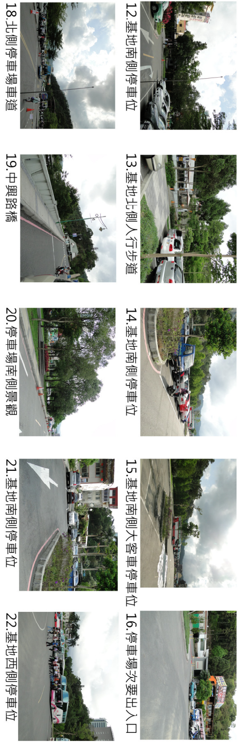
12. 基地南側停車位 13. 基地北側人行步道 14. 基地南側停車位 15. 基地南側大客車停車位 16. 停車場次要出入口 18. 北側停車場車道 19. 中興路橋 20. 停車場南側景觀 21. 基地南側停車位 22. 基地西側停車位