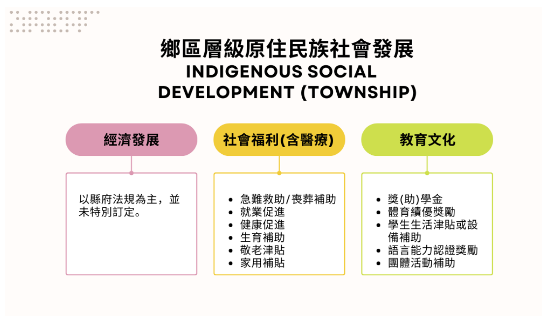
圖 3-2-2 鄉區層級的比較架構

有關上述兩項分析架構之資料來源，本研究採取次級資料蒐集，以各地方政府公開公告之法規與補助措施為主要素材。具體而言，本研究於縣市層級蒐集南投縣政府、臺中市政府、苗栗縣政府與嘉義縣政府官方網站所揭露之原住民族相關制度資訊。另外，於鄉區層級，則蒐集這些縣市轄區內的原住民鄉區公所網站資料，包含南投縣之仁愛鄉、信義鄉與魚池鄉，臺中市之和平區，苗栗縣之泰安鄉與南庄鄉，以及嘉義縣之阿里山鄉等。研究團隊據此整理各地在經濟發展、社會福利（含醫療）與教育文化等面向之制度內容，作為制度比較分析之基礎。