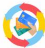
動用信用卡 循環利息