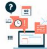
近期有貸款 遲繳紀錄