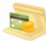
銀行帳戶 幾乎零存款