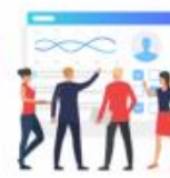
被多家金融 機構查閱