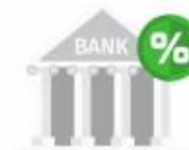
有申請其他 信用貸款