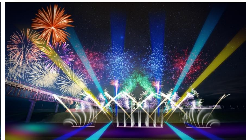
主題三、光域擴展 祈福四方