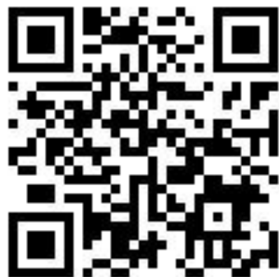
樂旅南投臉書專頁