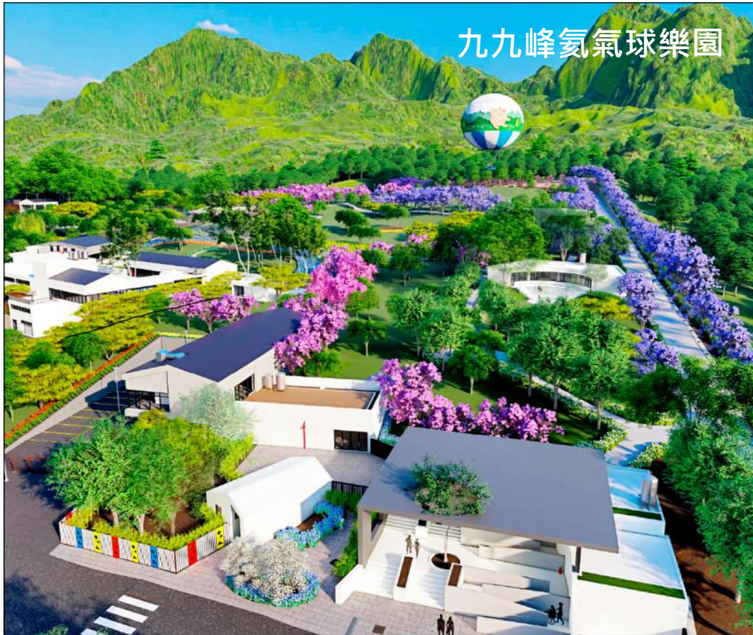
九九峰氦氣球樂園