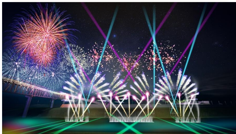
主題二、山河綻放 夢想展開