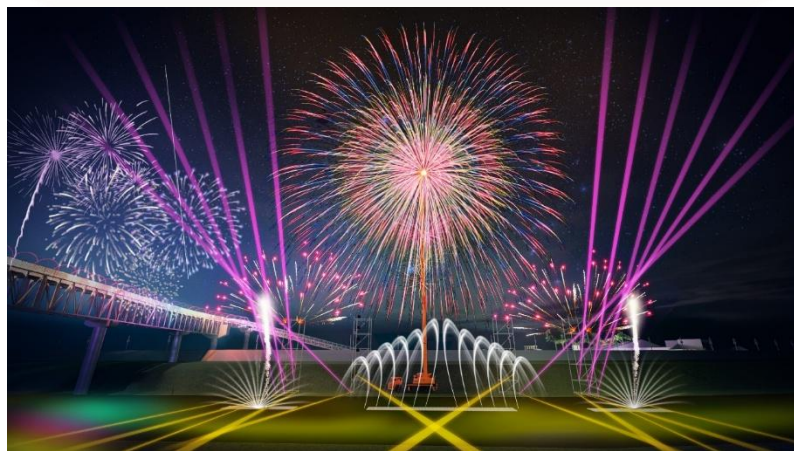
主題一、輪轉榮耀 點亮南投